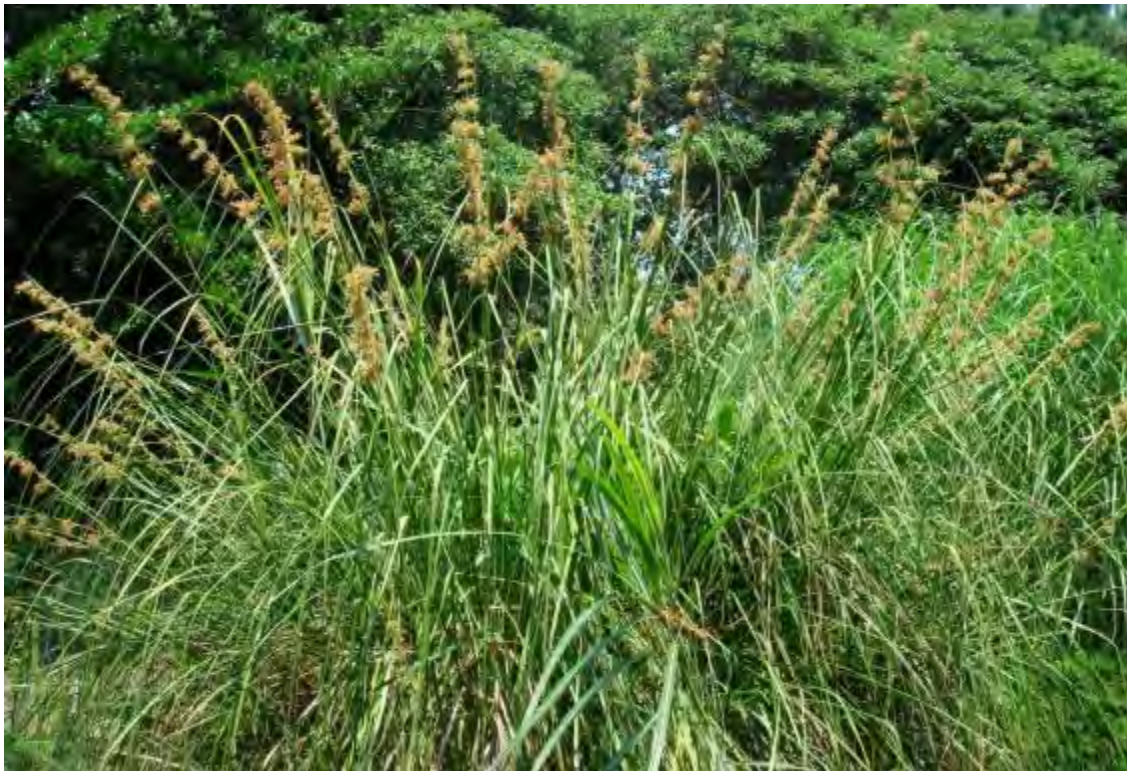
Cladium jamaicense (Cyperaceae) – Sawgrass