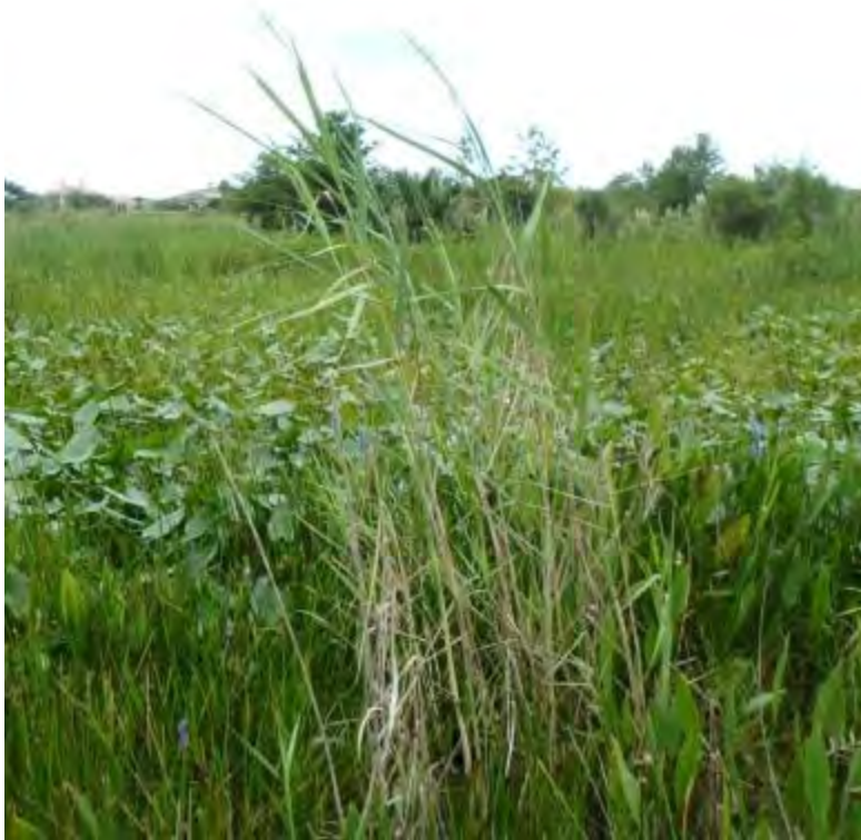
Phragmites australis (Poaceae) – Common Reed