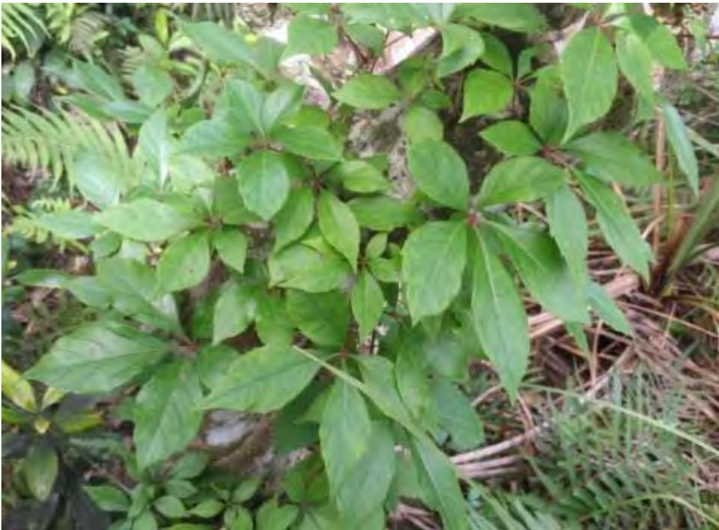
Parthenocissus quinquefolia (Vitaceae) - Virginia Creeper