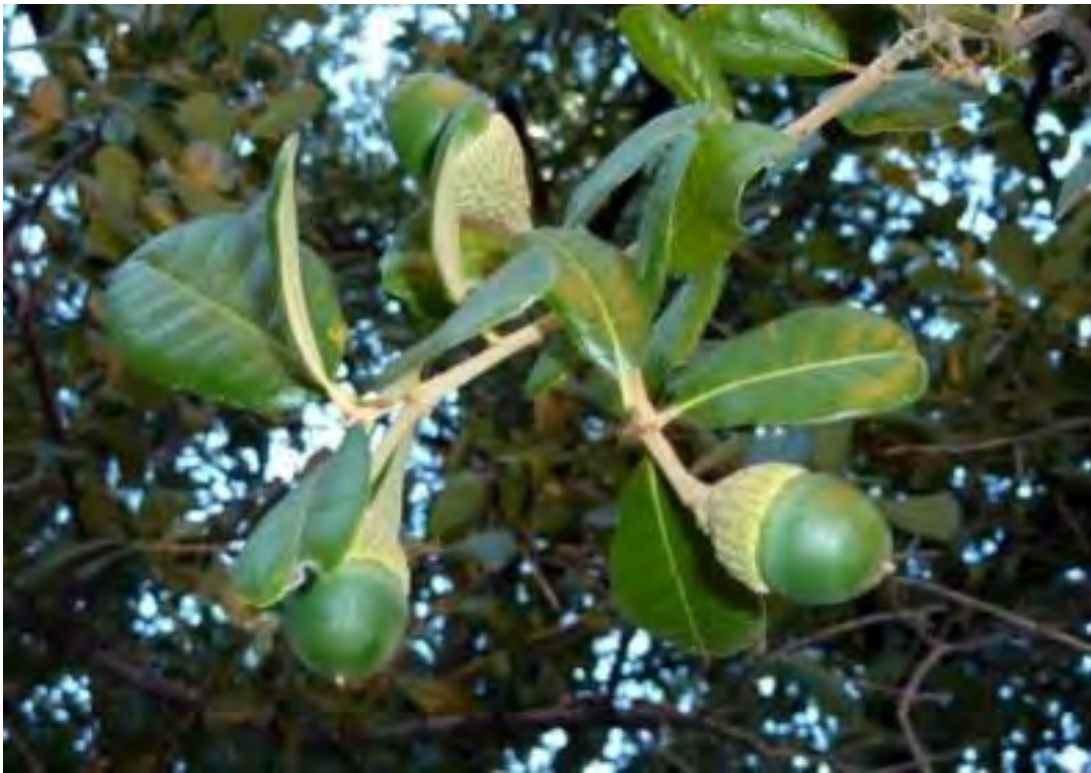
Quercus virginiana (Fagaceae) – Live Oak