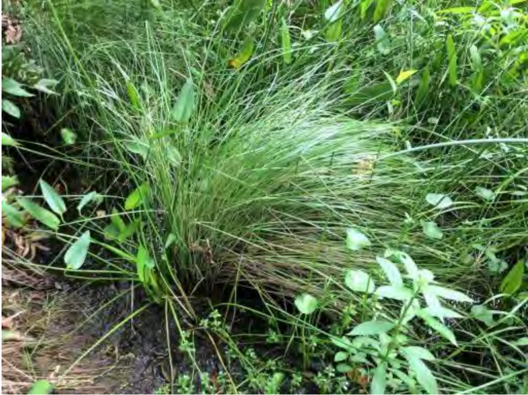
Spartina bakeri (Poaceae) – Sand Cordgrass