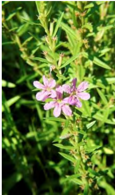
Lythrum alatum (Lythraceae) – Winged Lythrum