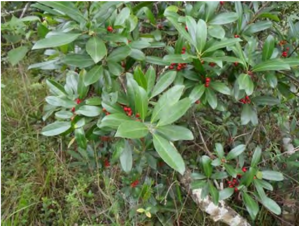
Ilex cassine (Aquifoliaceae) - Dahoon Holly