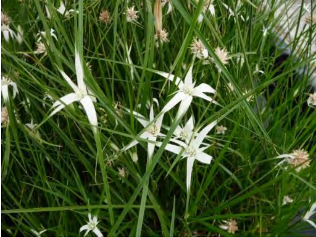
Dichromena (Rhynchospora) colorata (Cyperaceae) – Star Rush