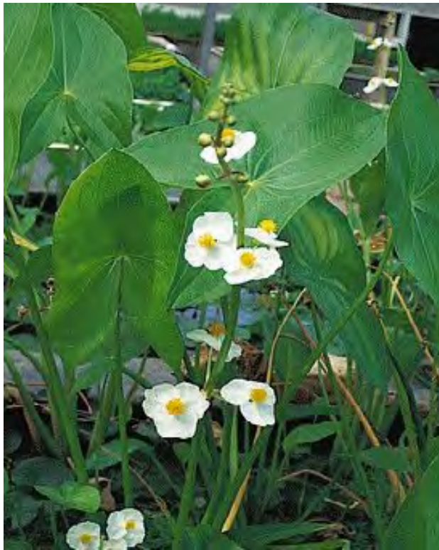
Sagittaria lancifolia (Alismataceae) - Duck Potato