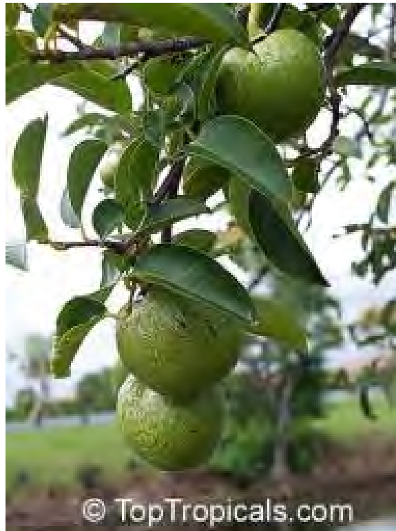
Annona glabra (Annonaceae) – Pond Apple