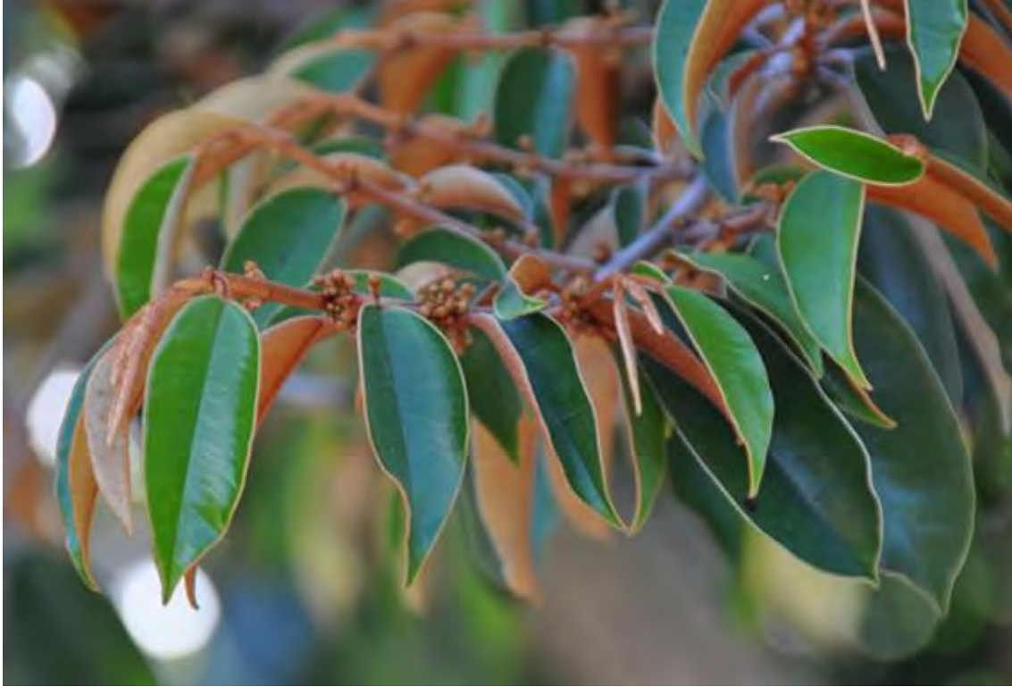
Chrysophyllum oliviforme (Sapotaceae) – Satinleaf (Threatened – State)