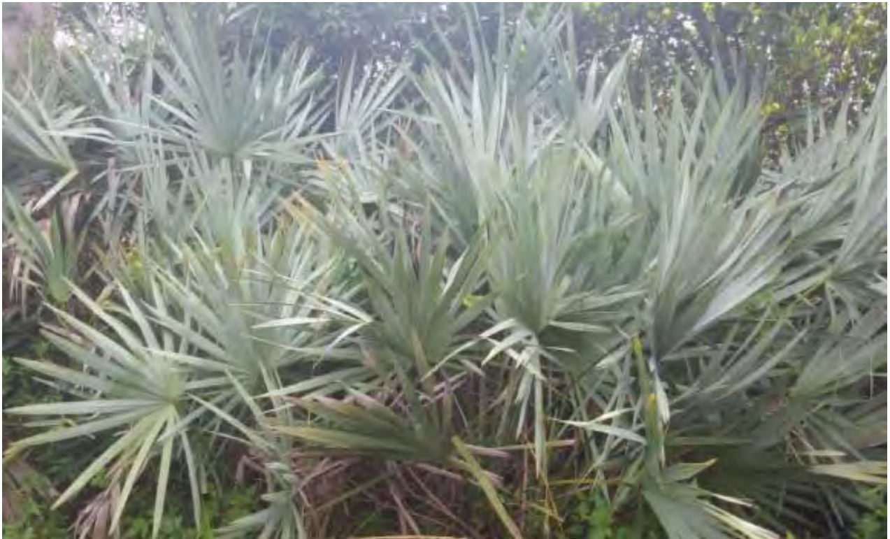
Serenoa repens (Arecaceae) - Saw Palmetto