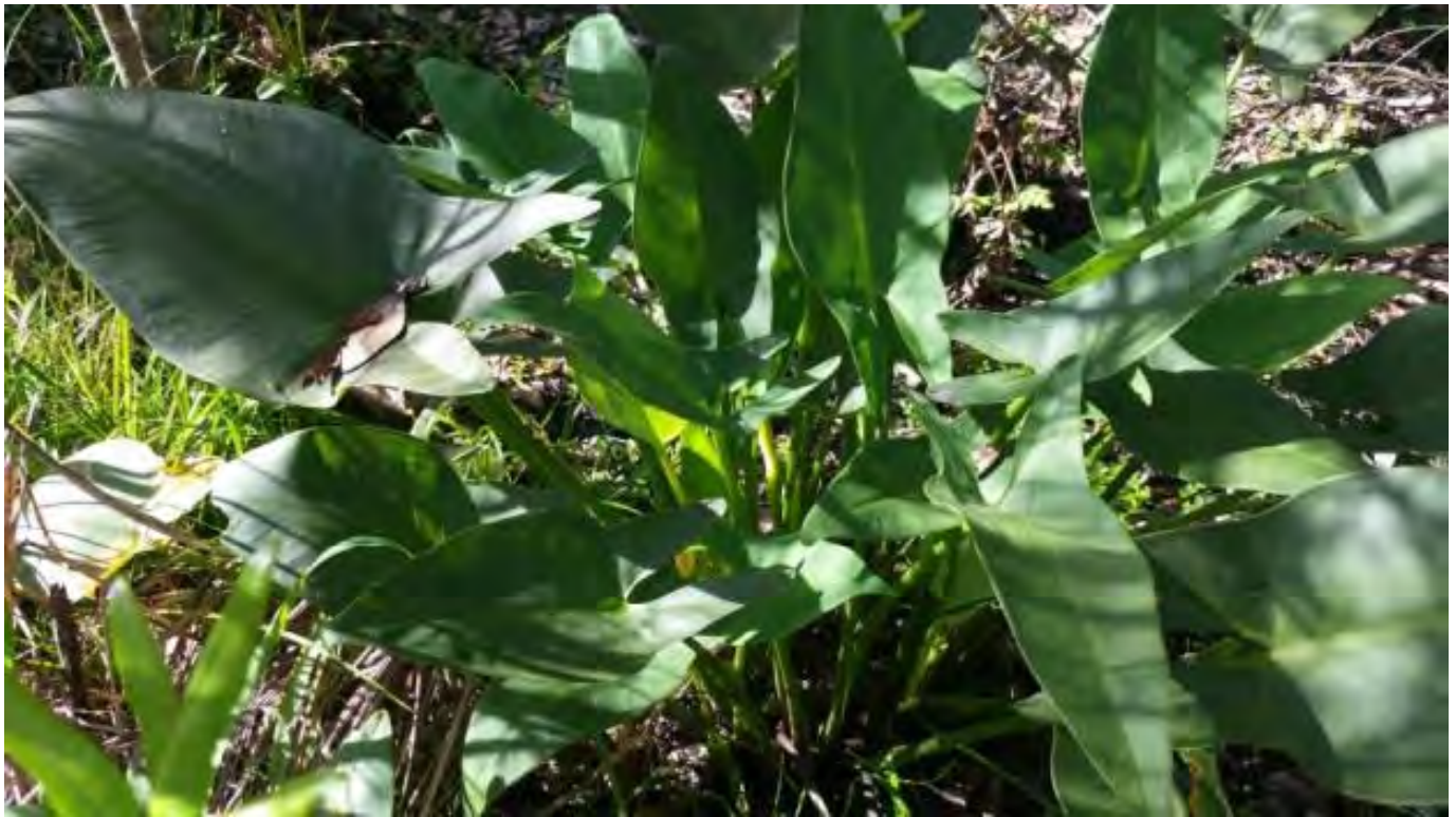
Peltandra virginica (Araceae) - Arrow Arrum