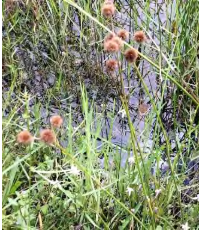
Juncus megacephalus (Juncaceae) – Bighead Rush