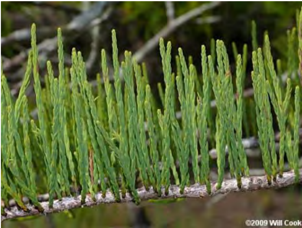
Taxodium ascendens (Cupressaceae) - Pond Cypress