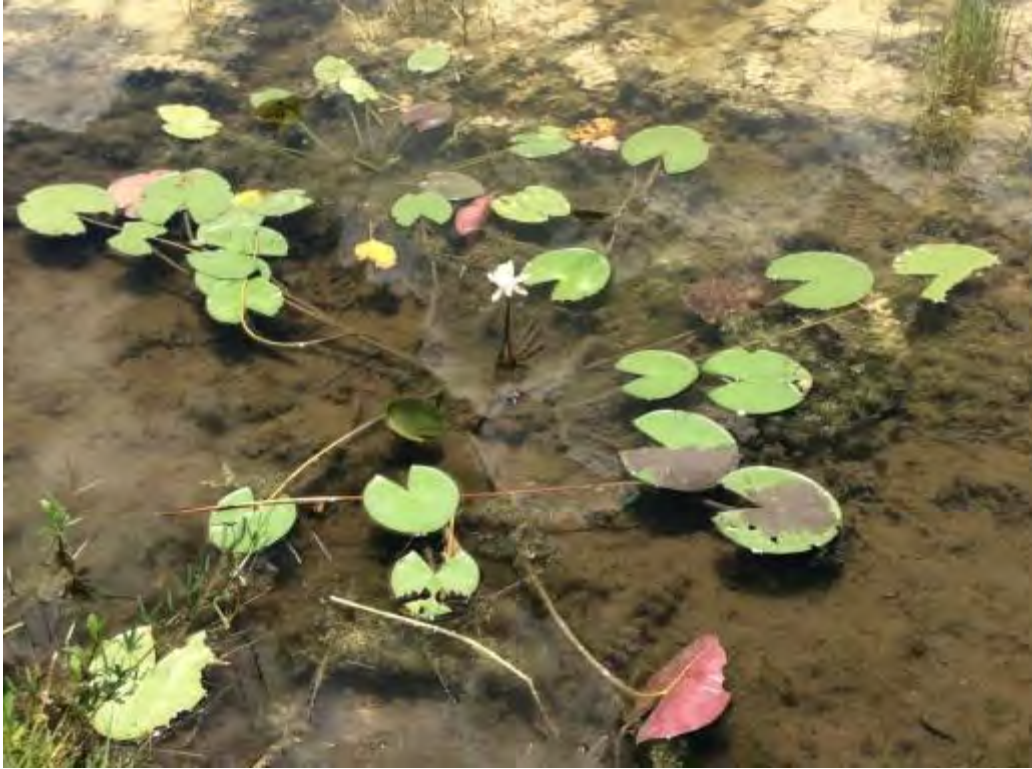
Nymphaea odorata (Nymphaeaceae) – Fragrant Water Lily