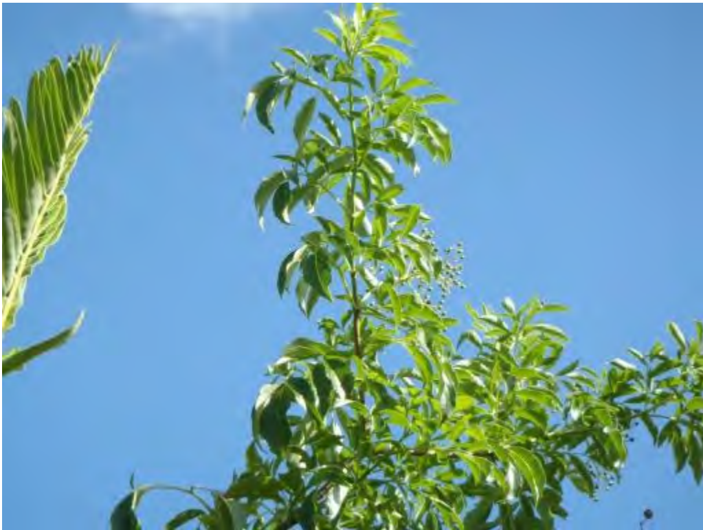
Sambucus nigra (Adoxaceae) - Elderberry