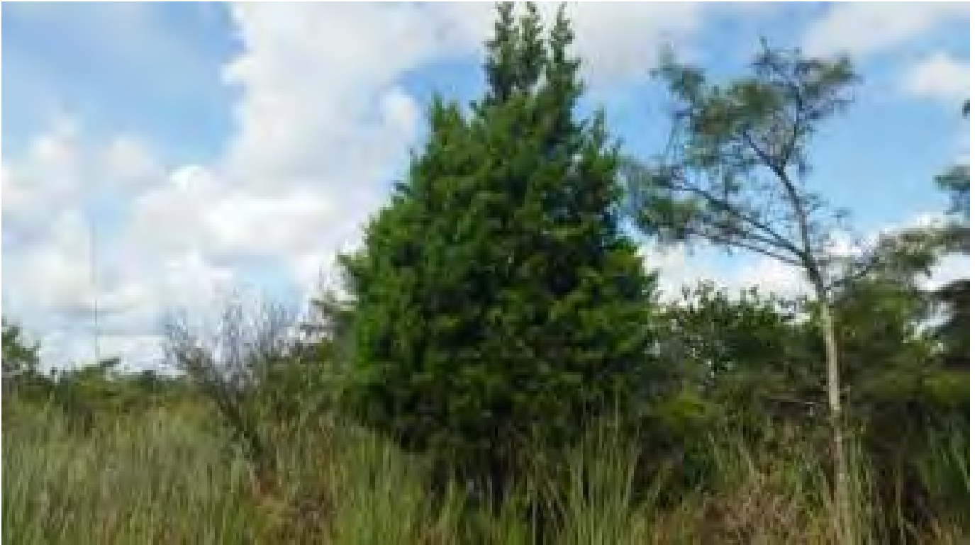
Juniperus virginiana (Cupressaceae) - Red Cedar