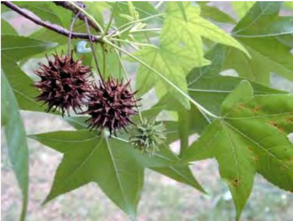
Liquidambar styraciflua (Hamamelidaceae) – Sweet gum