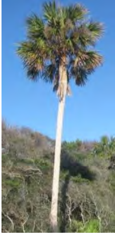
Sabal palmetto (Arecaceae) – Cabbage Palm