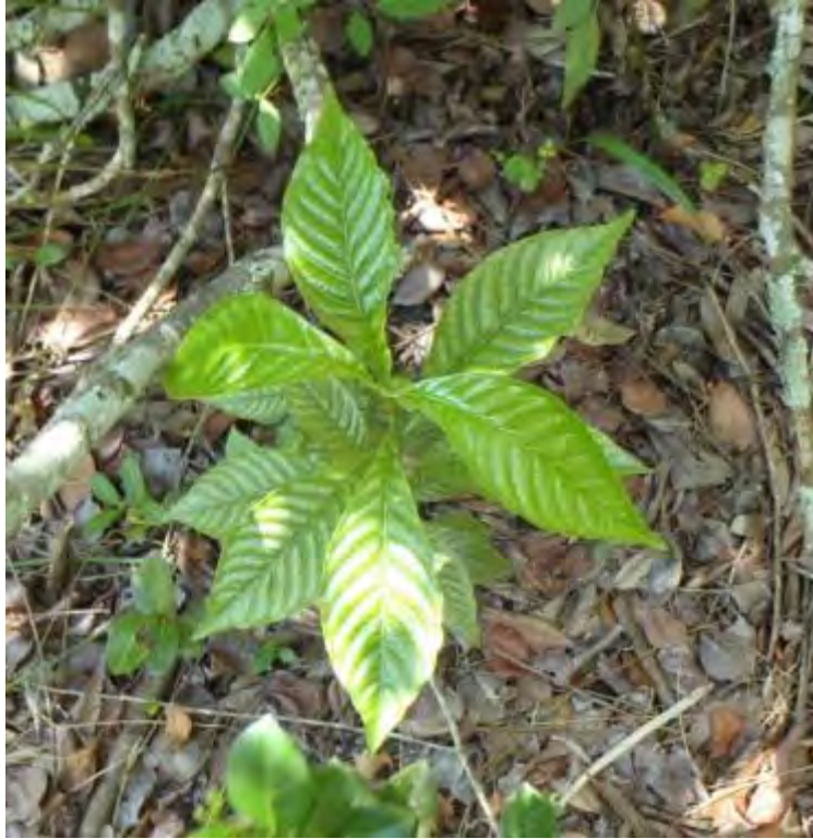
Psychotria nervosa (Rubiaceae) – Shiny Leaf Wild Coffee