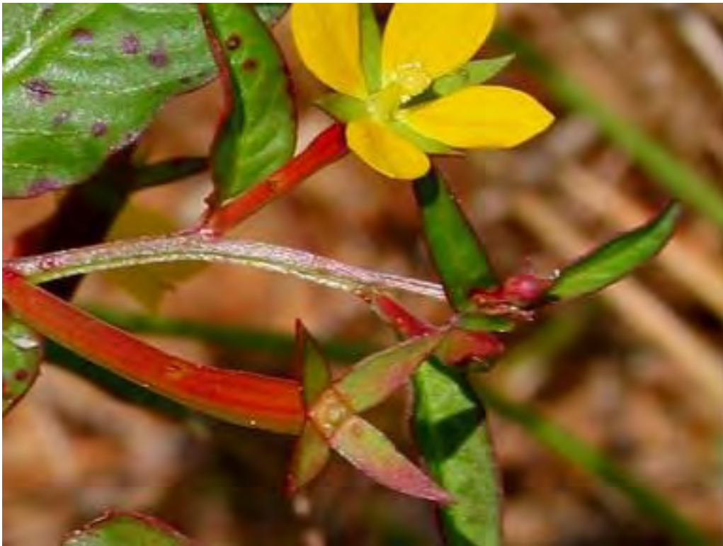
Ludwigia octovalvis (Onagraceae) - Mexican Primrose Willow