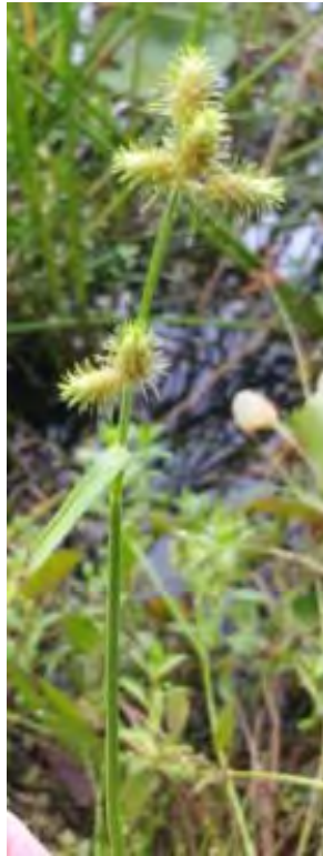
Fuirena breviseta (Cyperaceae) – Saltmarsh Umbrella Sedge