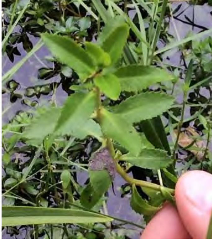
Proserpinaca palustris (Haloragaceae) – Mermaid Weed