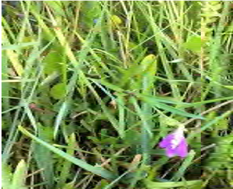
Justicia angusta (Acanthaceae) – Pineland Water-willow