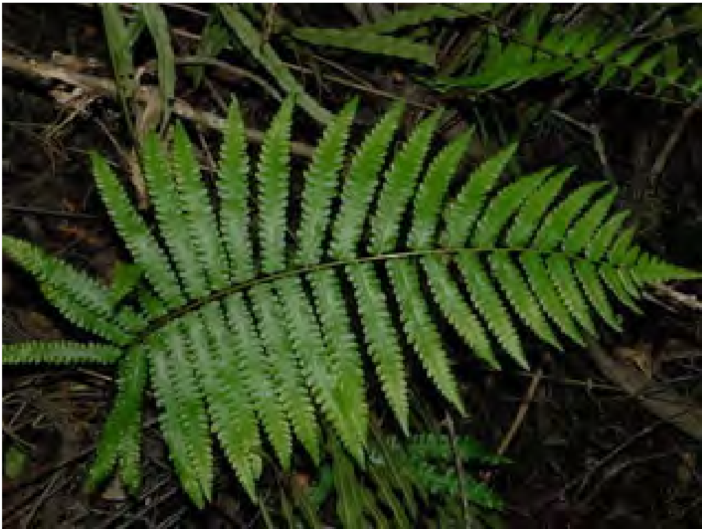
Thelypteris sp. (Thelypteridaceae) – Maiden Fern