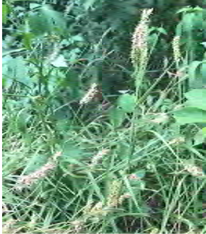
Cenchrus spinifex (Poaceae) – Coastal Sandbur