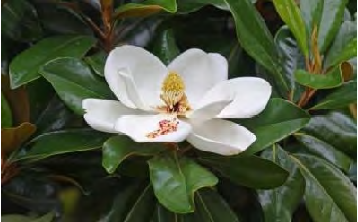
Magnolia grandiflora (Magnoliaceae) – Sweet Bay Magnolia