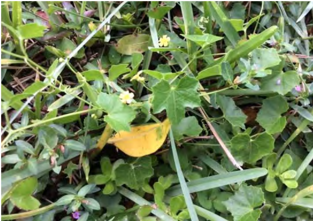
Melothria pendula (Cucurbitaceae) – Creeping Cucumber