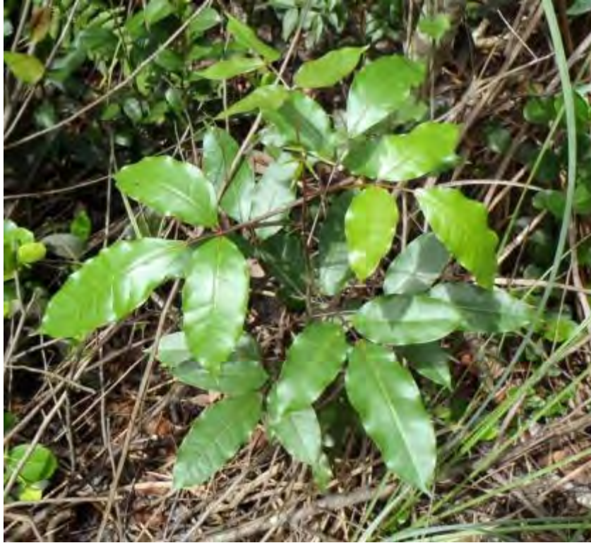
Bursera simaruba (Burseraceae) – Gumbo Limbo