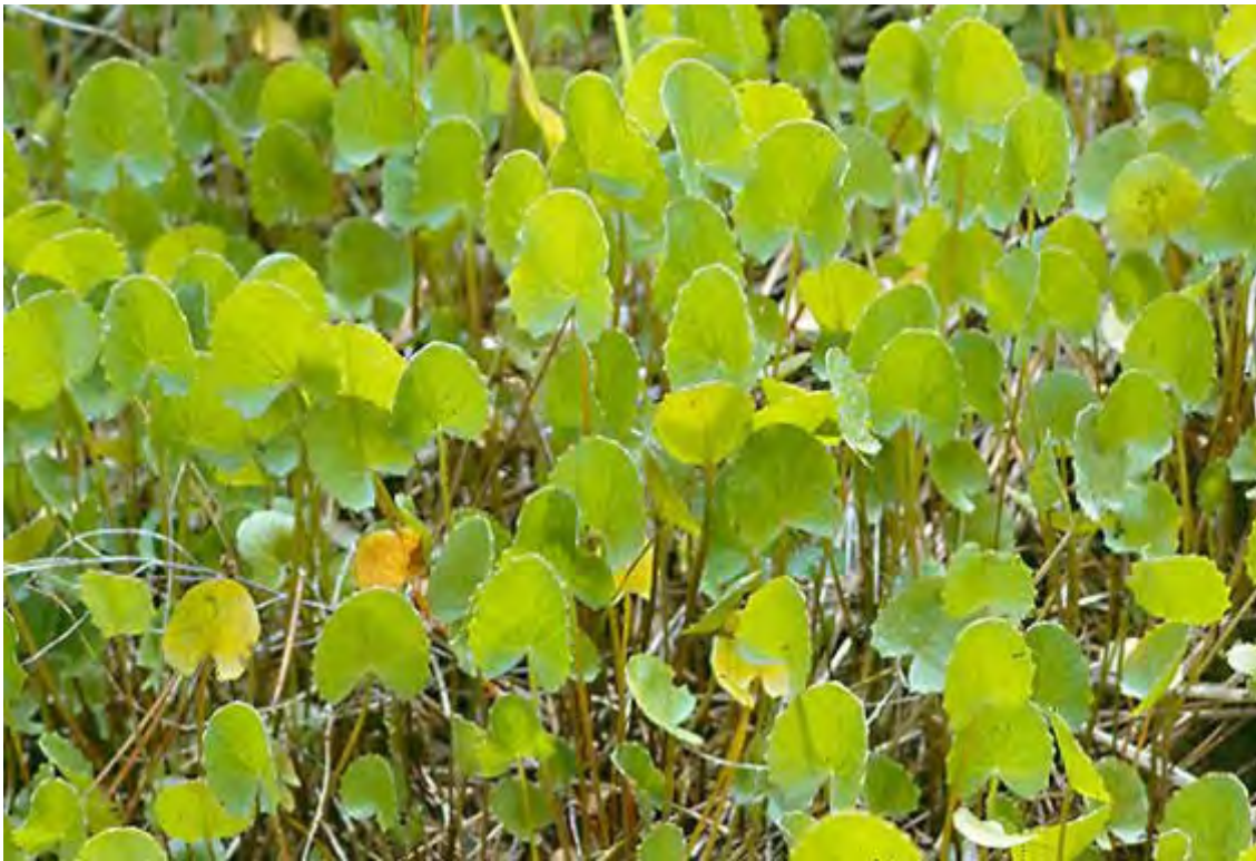
Centella asiatica (Apiaceae) – Coinwort