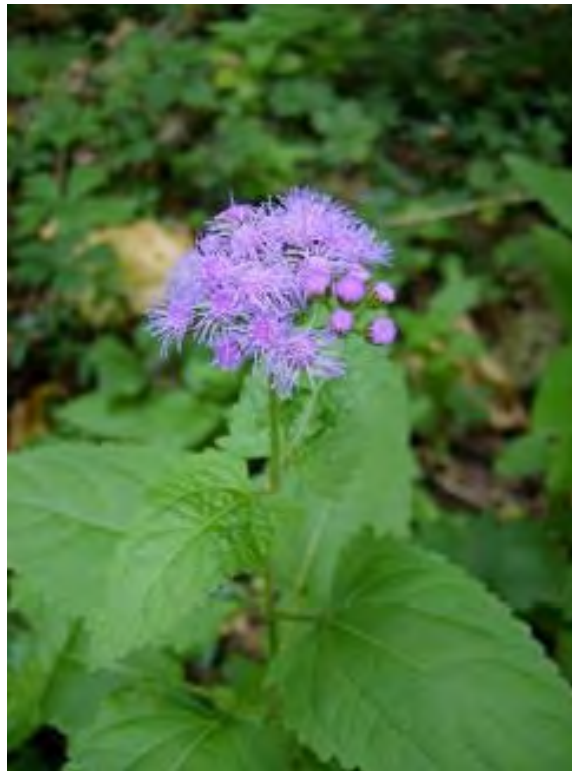
Conoclinium coelestinum (Asteraceae) – Blue Mistflower