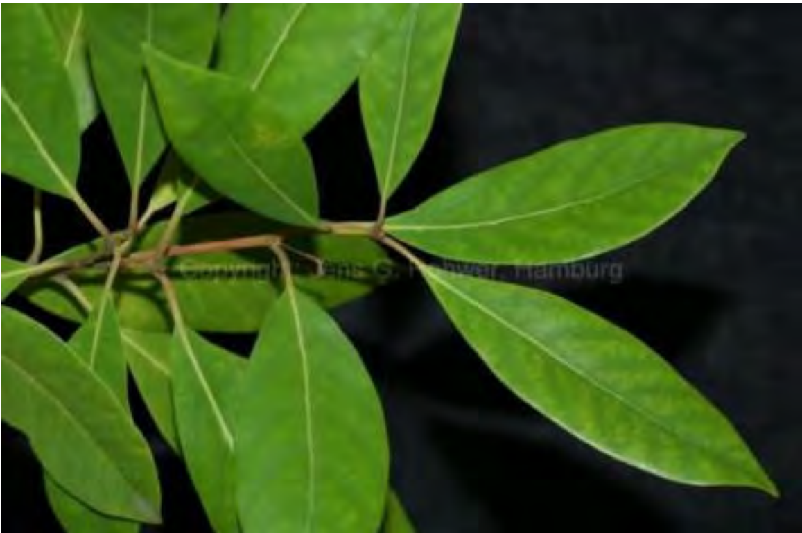
Persea borbonia (Lauraceae) - Red Bay