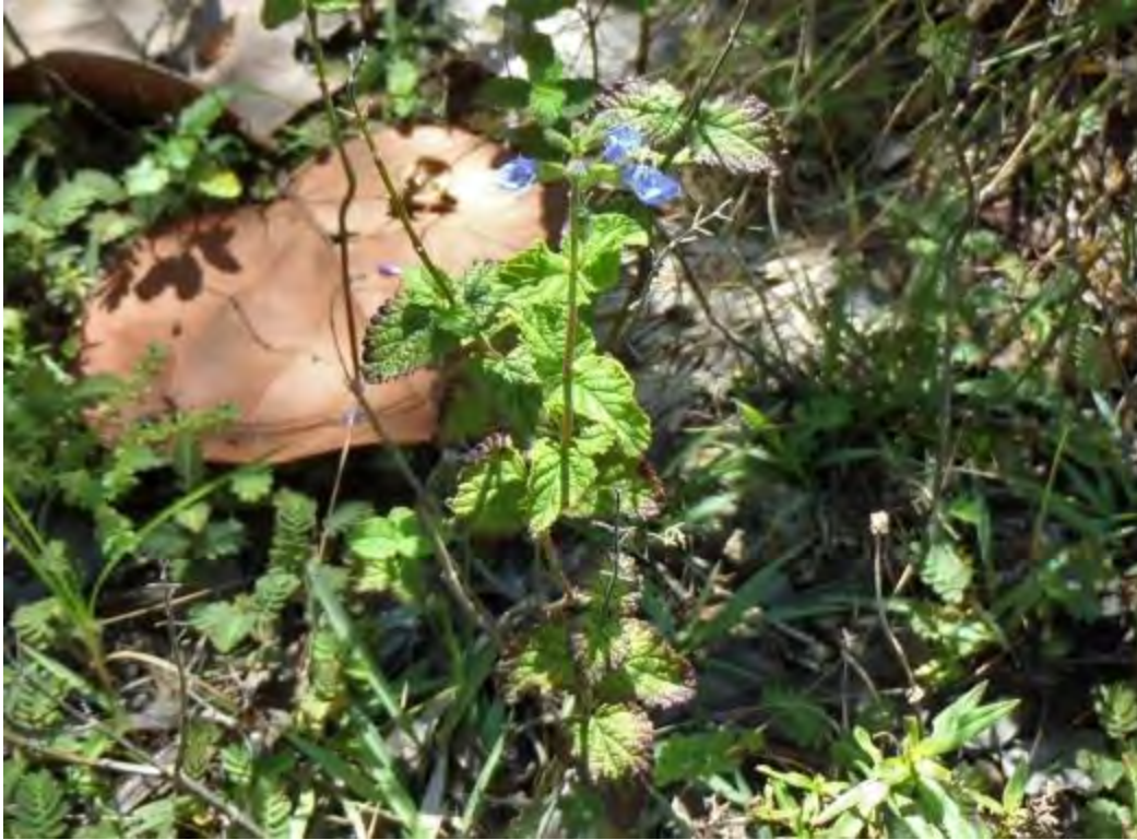
Salvia misella (Lamiaceae) – Southern River Sage