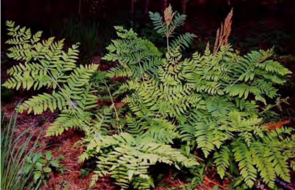
Osmunda regalis (Osmundaceae) – Royal Fern