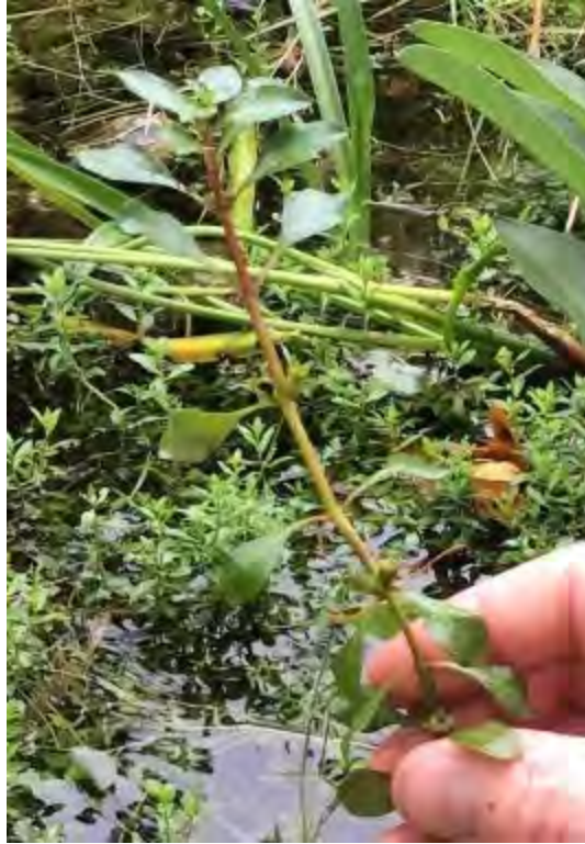
Ludwigia repens (Onagraceae) – Creeping Primrose-willow