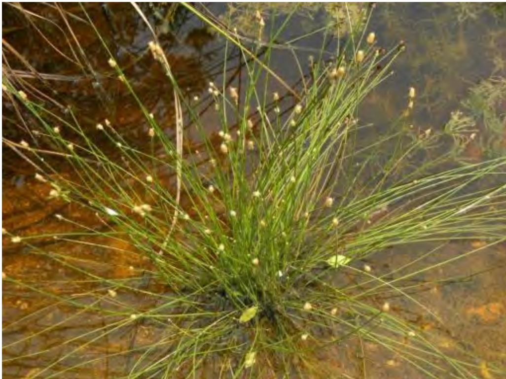
Eleocharis geniculata (Cyperaceae) – Canada Spikerush