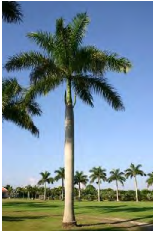
Roystonea elata (Arecaceae) – Royal Palm