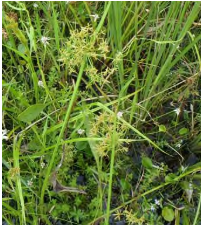
Cyperus haspan (Cyperaceae) – Haspan Flatsedge