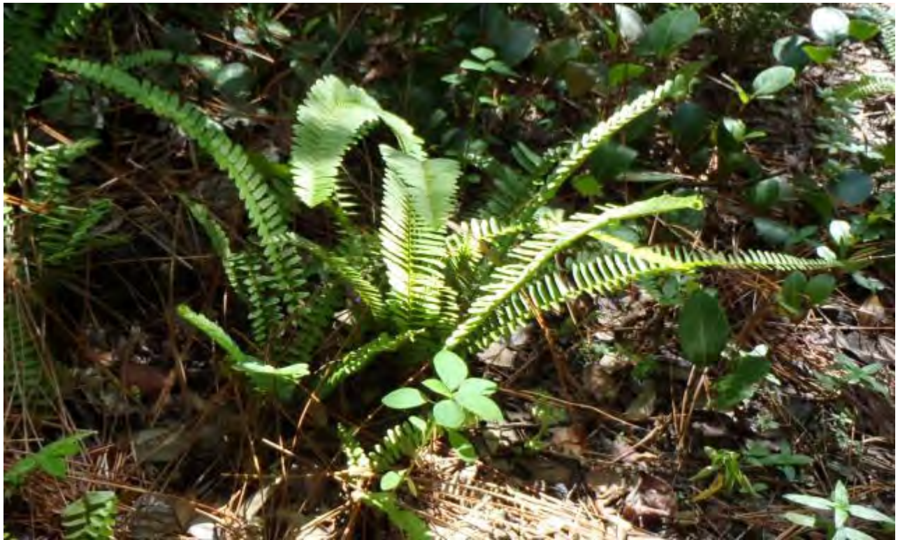
Nephrolepis exaltata (Nephrolepidaceae) – Sword Fern