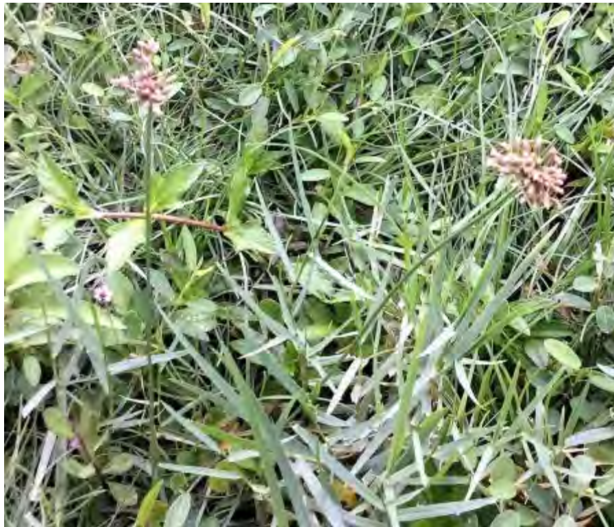
Fimbristylis cymosa (Cyperaceae) – Hurricane Grass