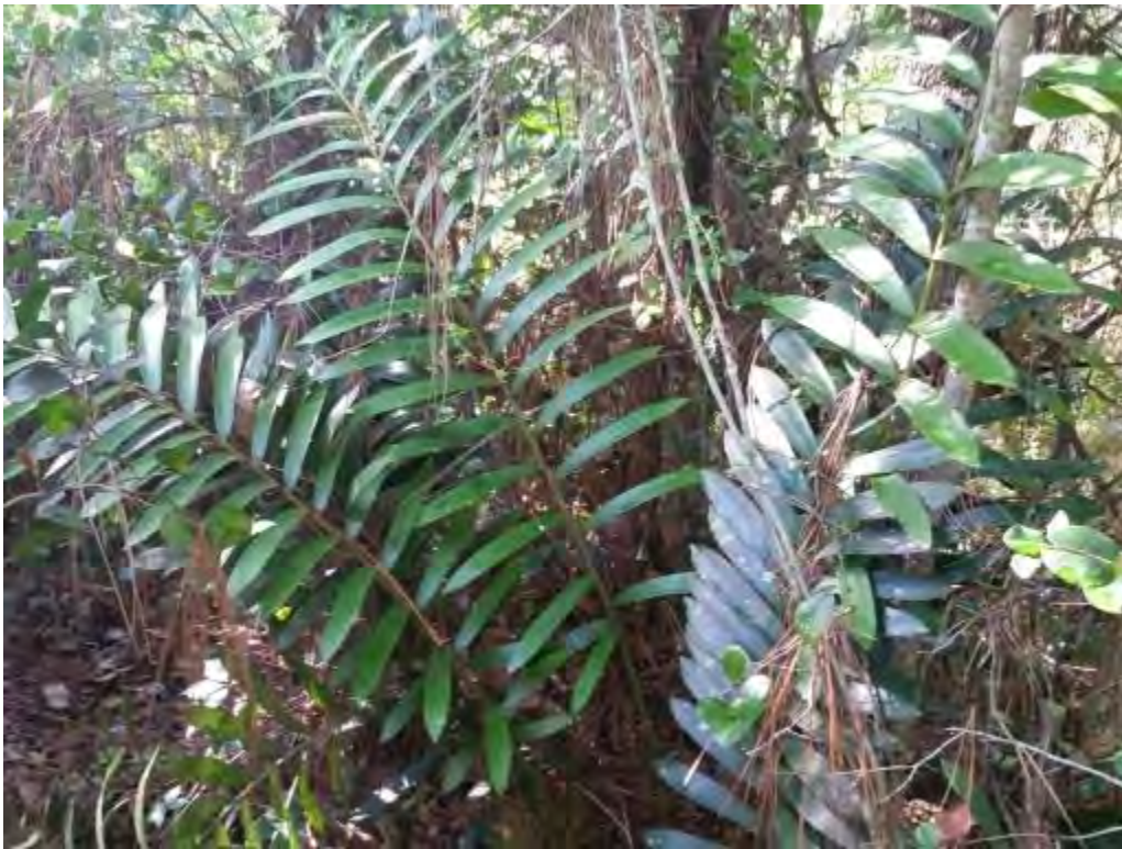
Zamia pumila (Zamiaceae) – Florida Coontie