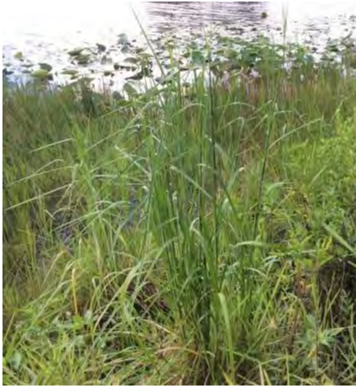
Andropogon glomeratus (Poaceae) – Bushy Bluestem