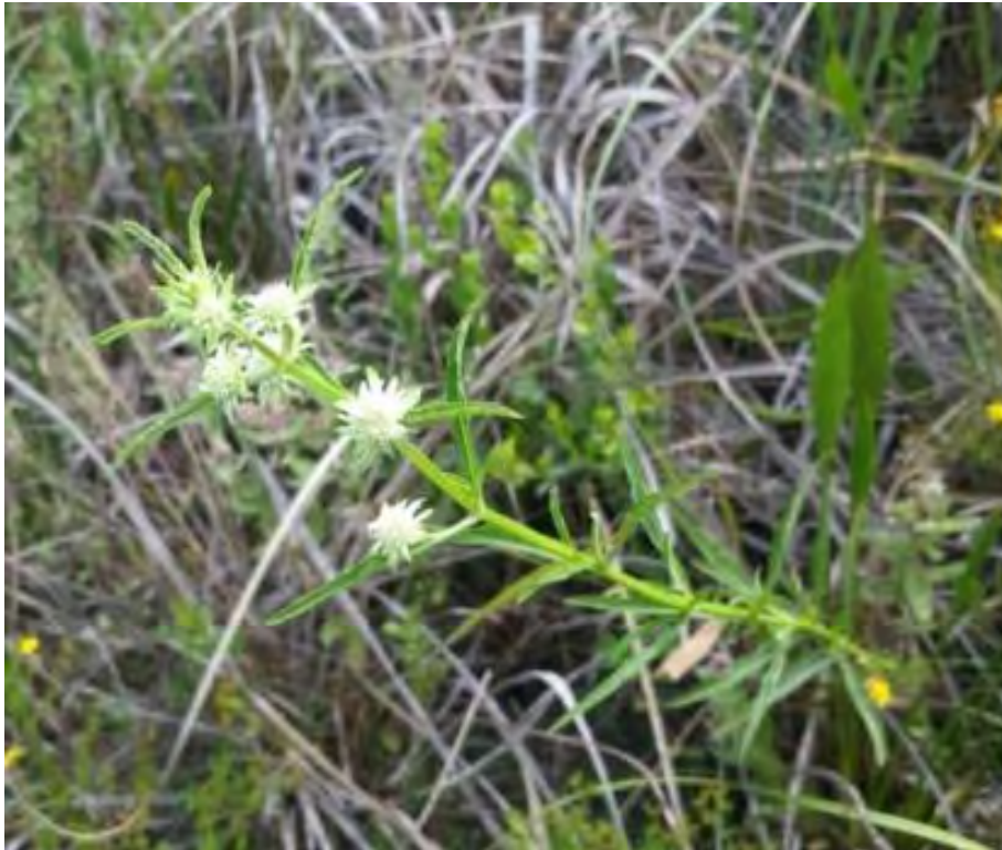
Hyptis alata (Lamiaceae) - Clusted Bushmint