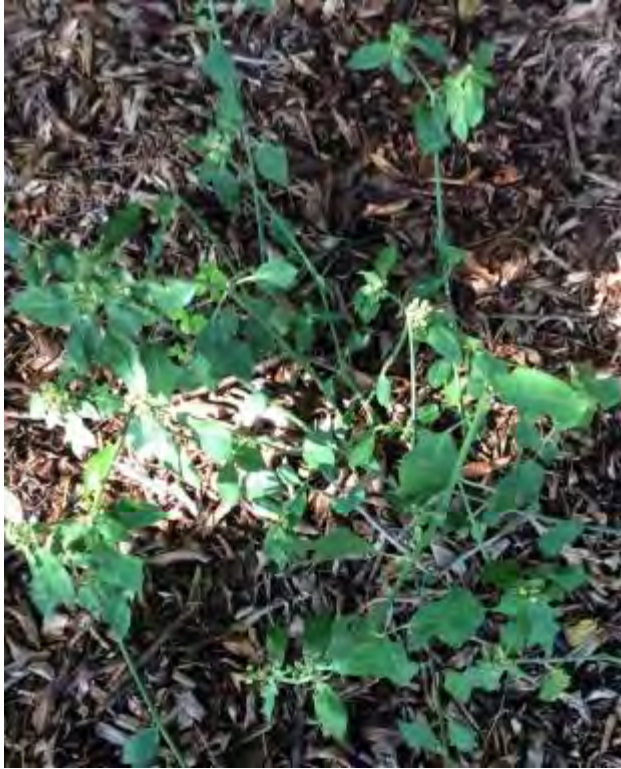
Poinsettia heterophylla (Euphorbiaceae) – Mexican Fireplant