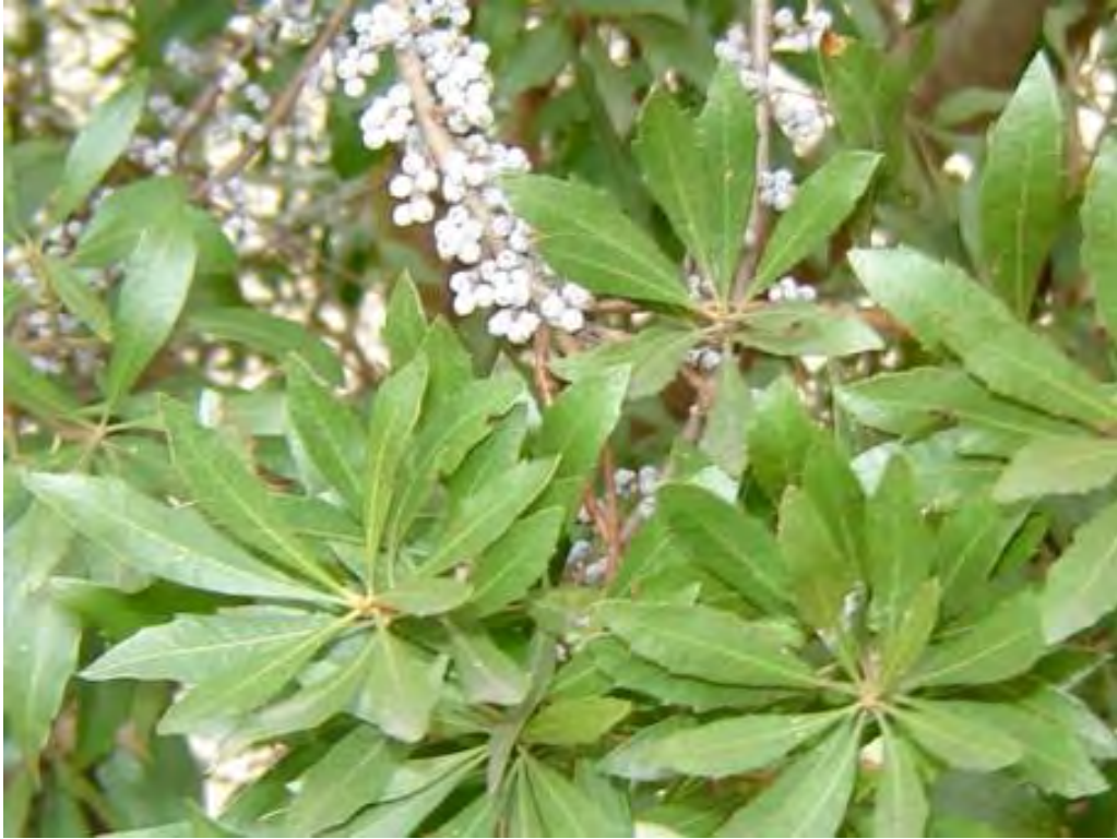
Myrica cerifera (Myricaceae) - Wax Myrtle