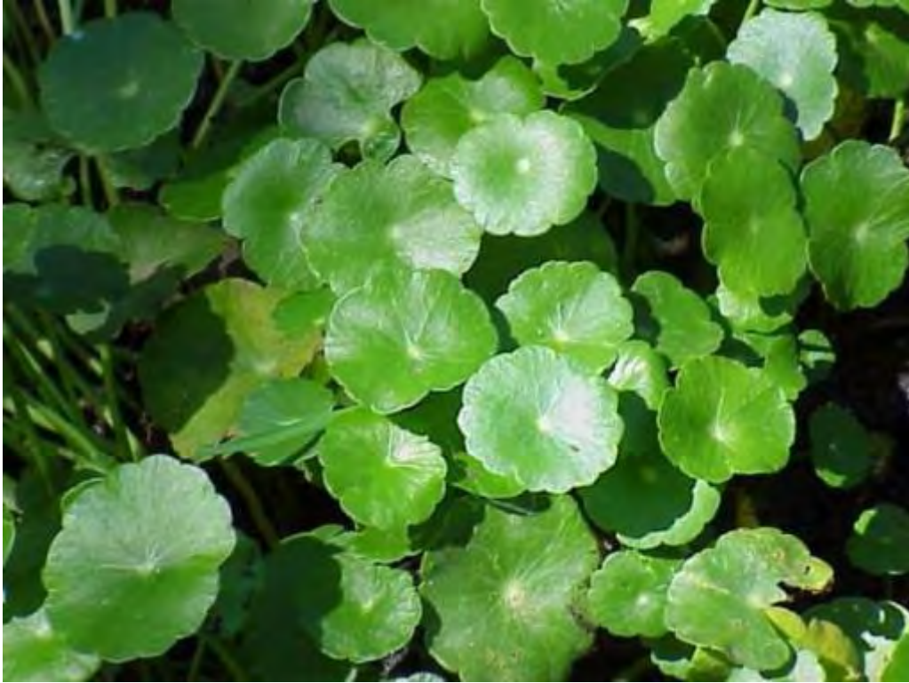
Hydrocotyle umbellata (Apiaceae) – Pennywort