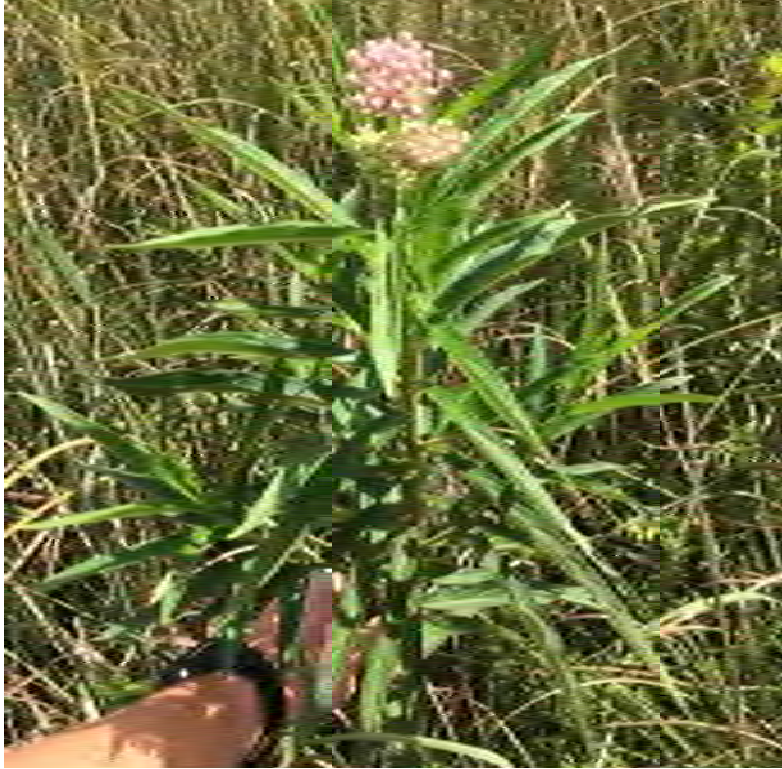
Asclepias incarnata (Apocynaceae) – Swamp Milkweed