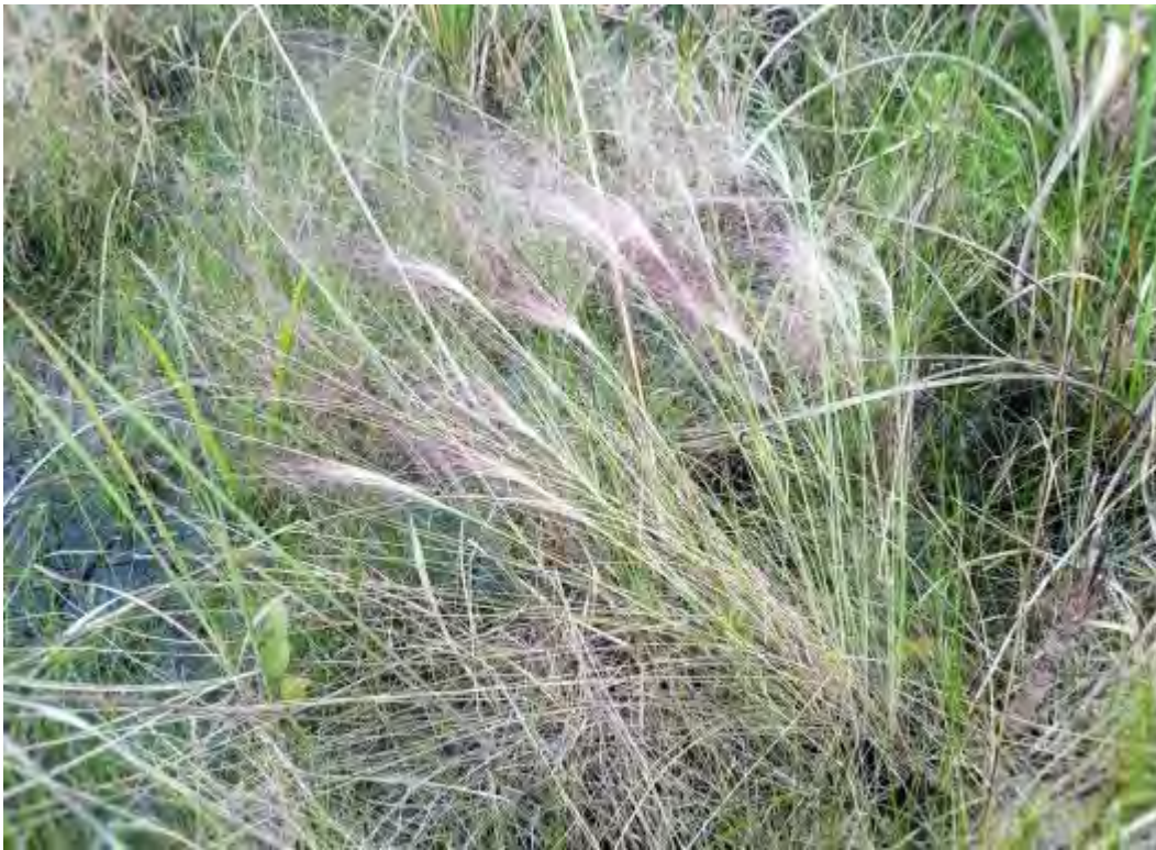
Muhlenbergia capillaris (Poaceae) – Hairawn Muhly