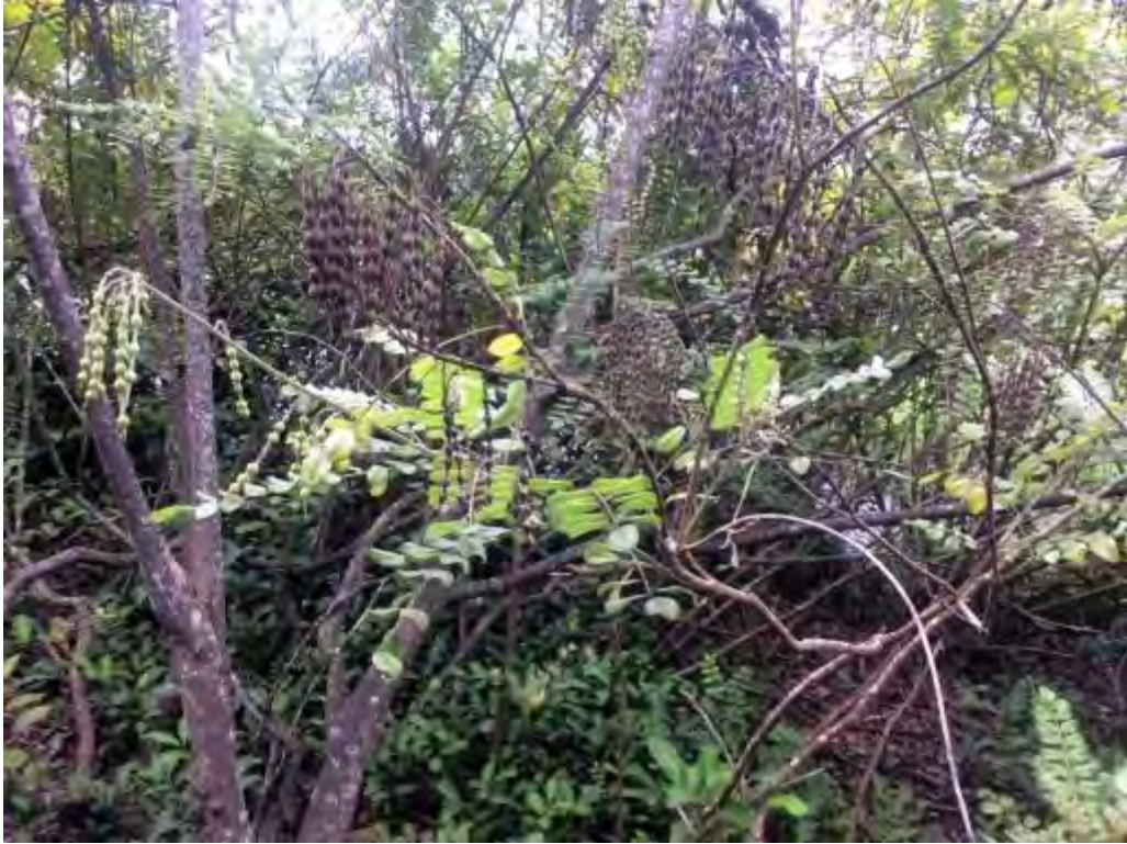
Sophora tomentosa (Fabaceae) – Yellow Necklacepod