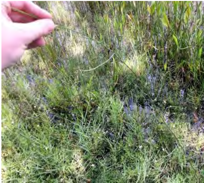
Symphyotrichum subulatum (Asteraceae) – Annual Saltmarsh Aster