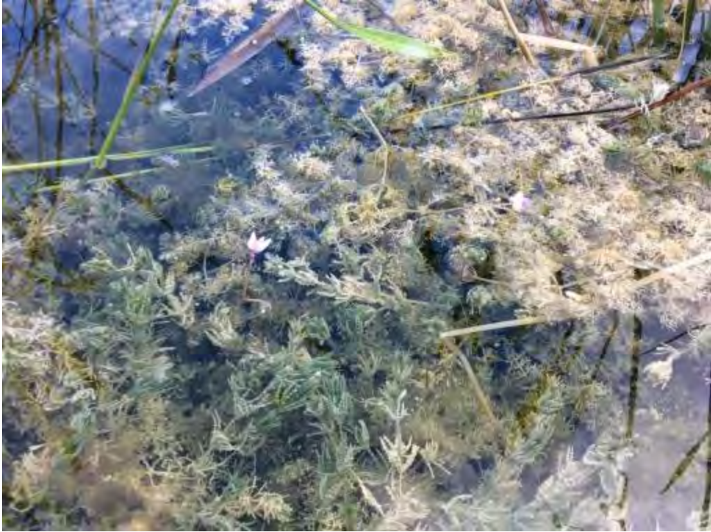
Utricularia purpurea (Lentibulariaceae) – Eastern Purple Bladderwort