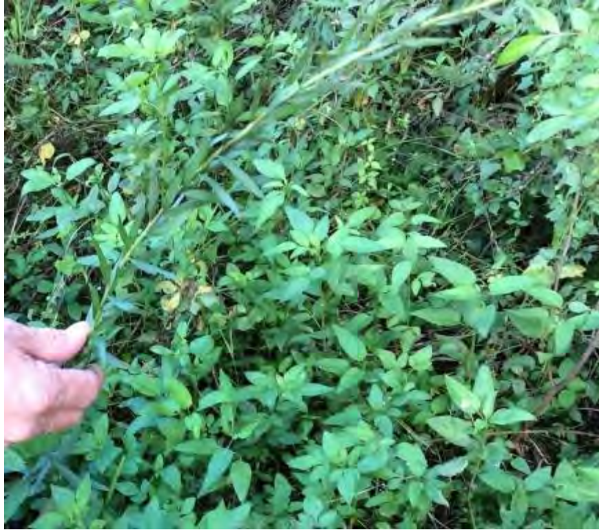
Solidago sempervirens (Asteraceae) – Seaside Goldenrod