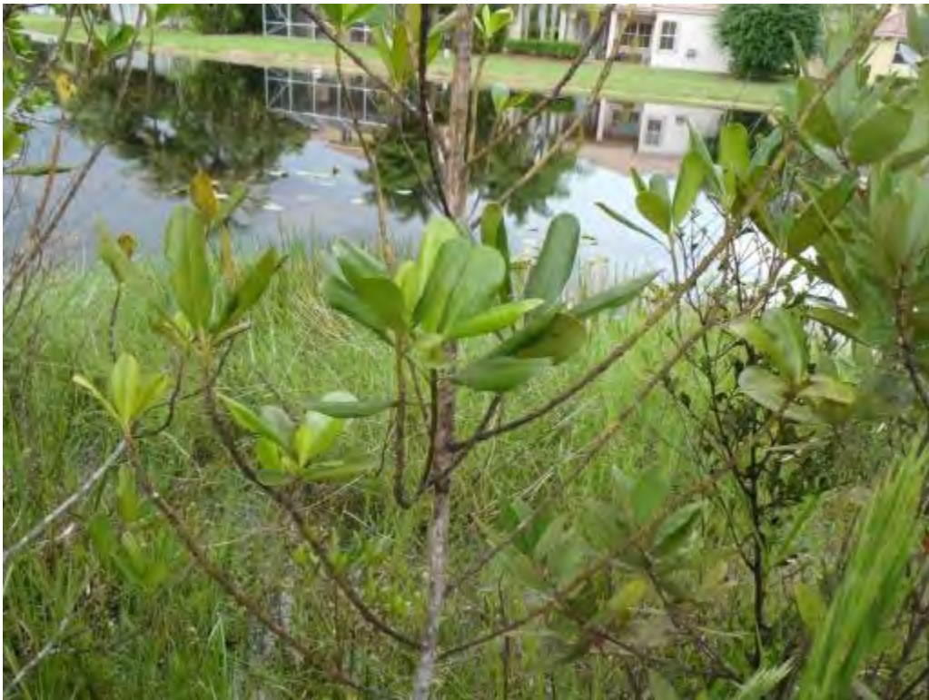
Myrsine cubana (Myrsinaceae) - Myrsine