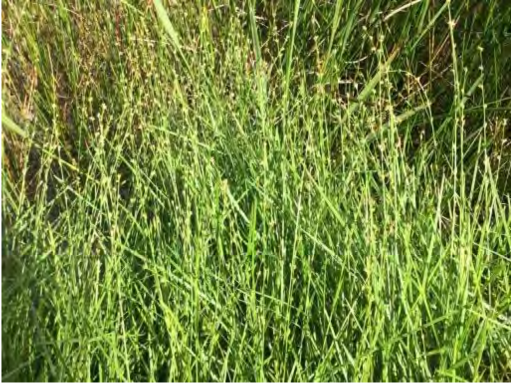
Scleria verticillata (Cyperaceae) – Low Nutrush