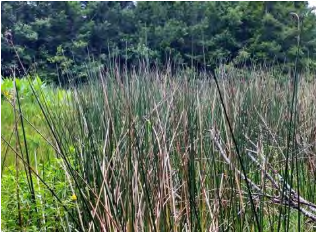
Scirpus californicus (Cyperaceae) – California Bulrush