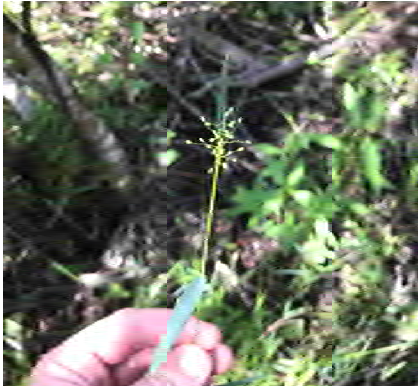
Dicanthelium oligosanthos (Poaceae) – Heller's Witchgrass