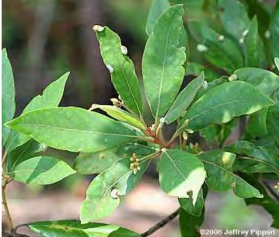
Persea palustris (Lauraceae) - Swamp Bay