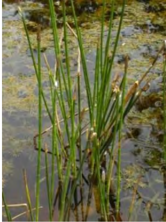
Eleocharis interstincta (Cyperaceae) – Jointed Spikerush