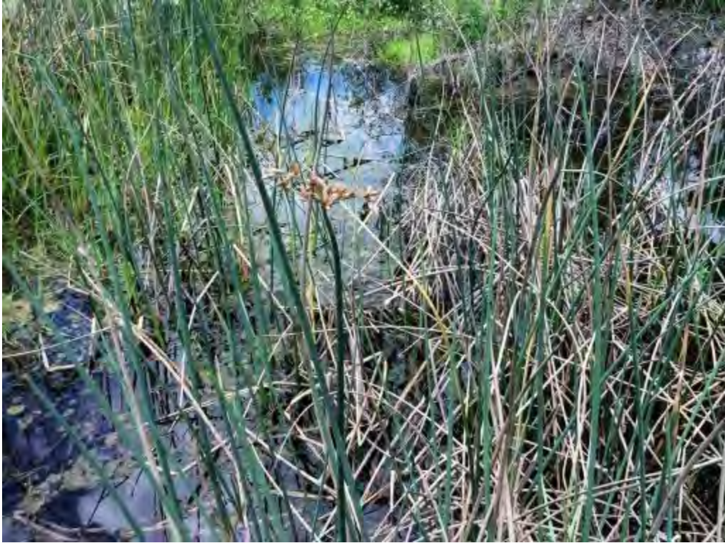
Schoenoplectus tabernaemontani (Cyperaceae) – Softstem Bulrush