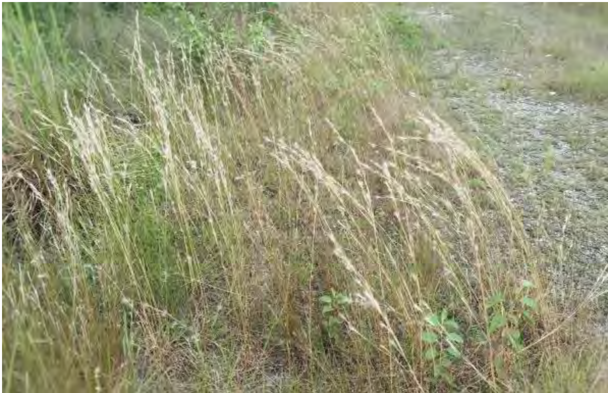
Andropogon virginicus (Poaceae) – Broomsedge Bluestem