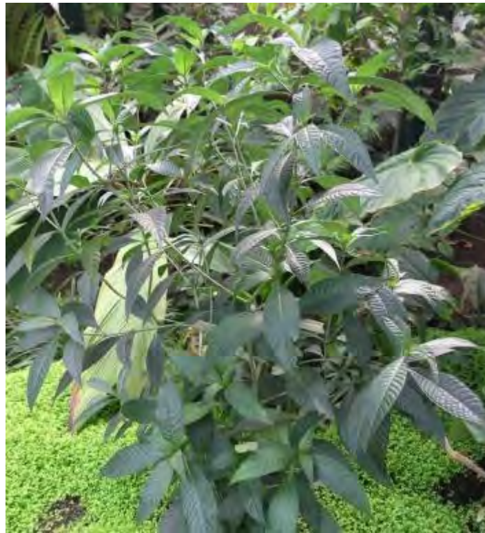
Psychotria tenuifolia (Rubiaceae) – Dull Leaf Wild Coffee