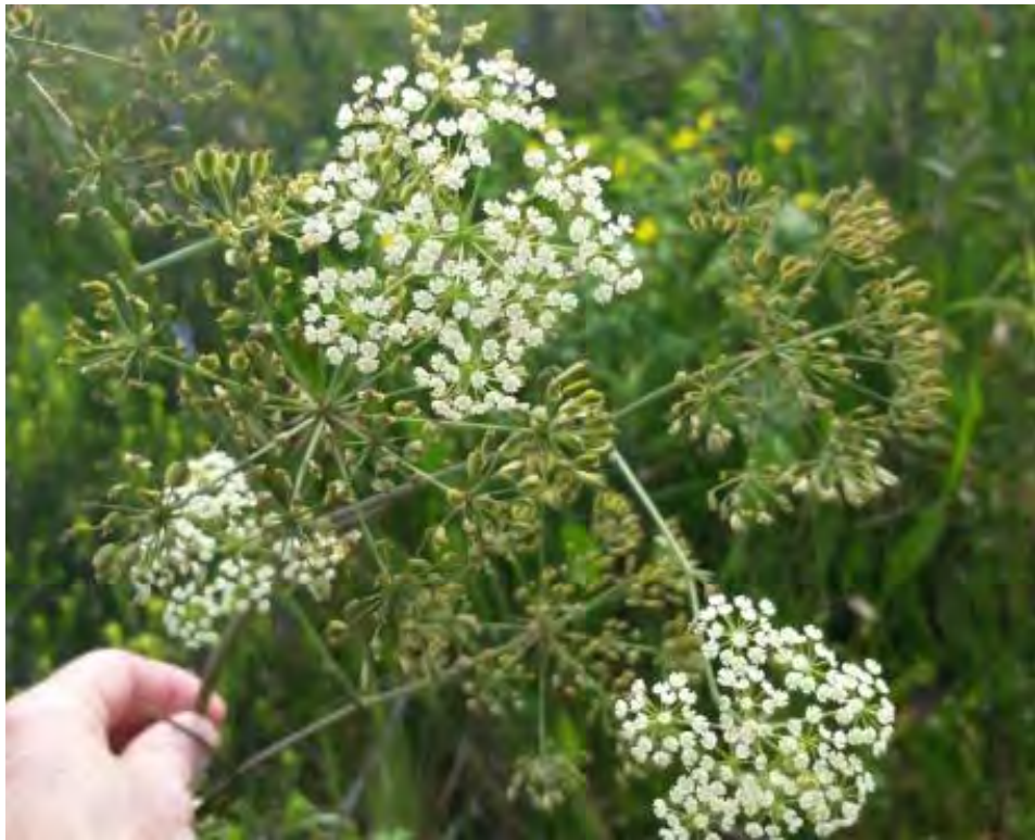
Tiedemannia filiformis (Apiaceae) – Water Cowbane