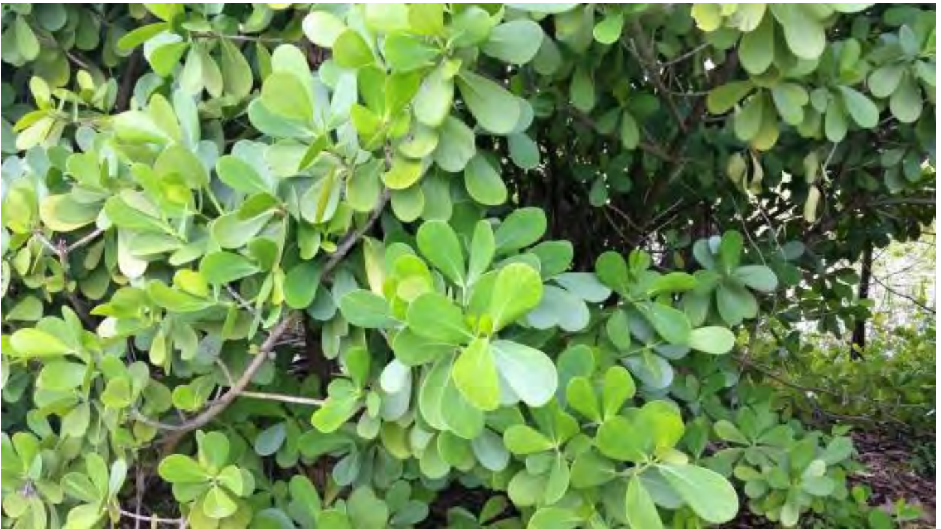
Clusia rosea (Clusiaceae) – Pitch Apple