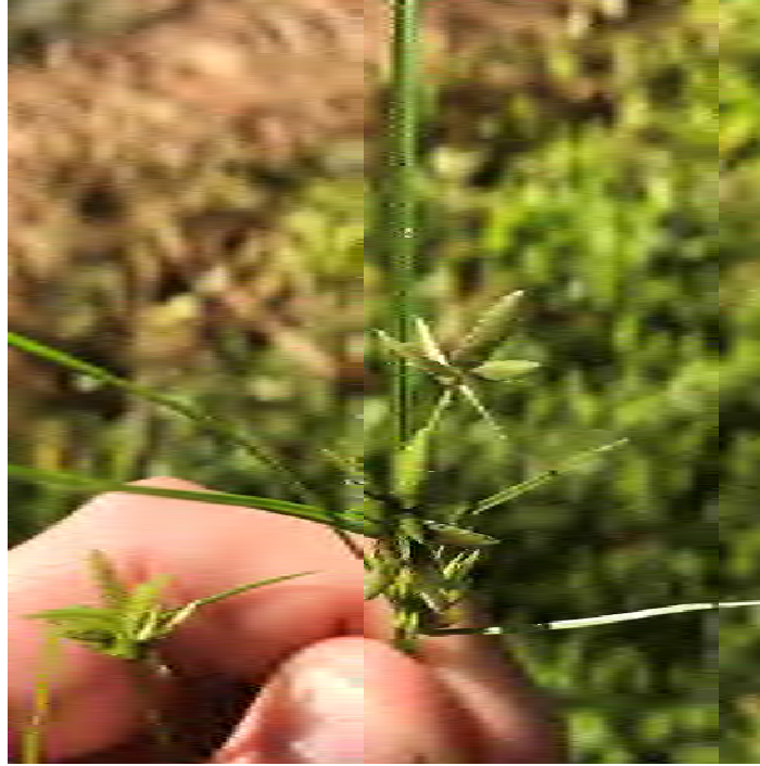
Cyperus compressus (Cyperaceae) – Poorland Flatsedge