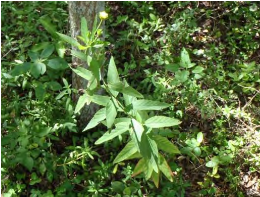
Sida rhombifolia (Malvaceae) – Indian Hemp