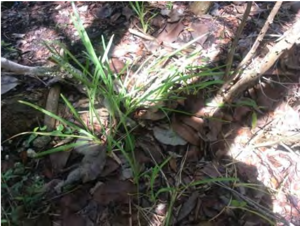
Stenotaphrum secundatum (Poaceae) – St. Augustine Grass