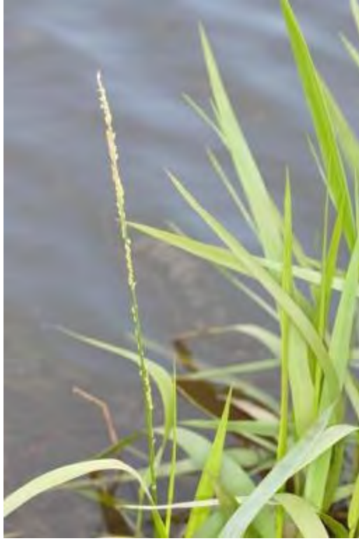
Panicum hemitomon (Poaceae) – Maidencane