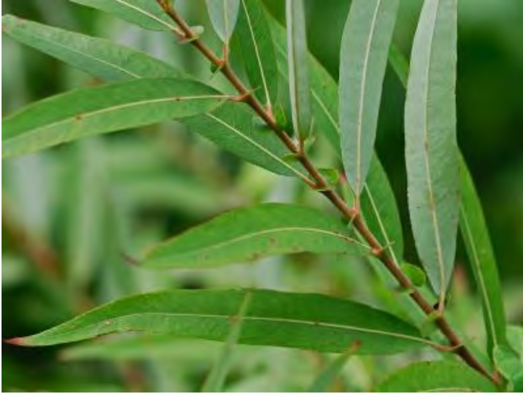
Salix caroliniana (Salicaceae) – Coastal Plain Willow