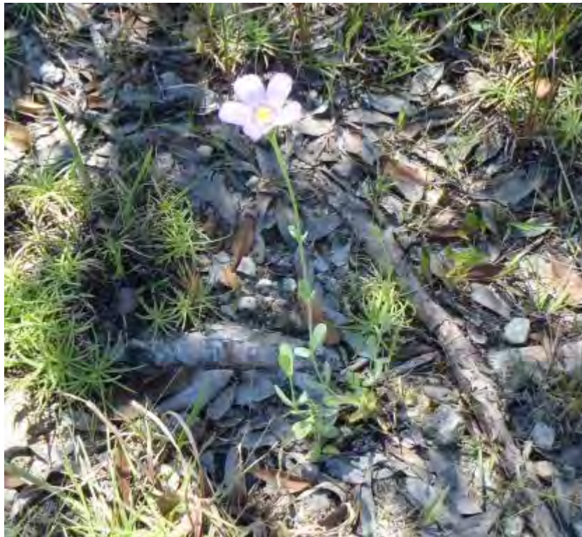
Eustoma exaltatum (Gentianaceae) – Marsh Gentian