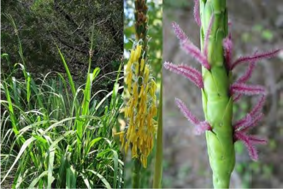
Tripsacum dactyloides (Poaceae) – Fakahatchee Grass (Gamma Grass)