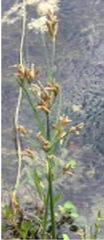
Fimbristylis dichotoma (Cyperaceae) – Forked Fimbry