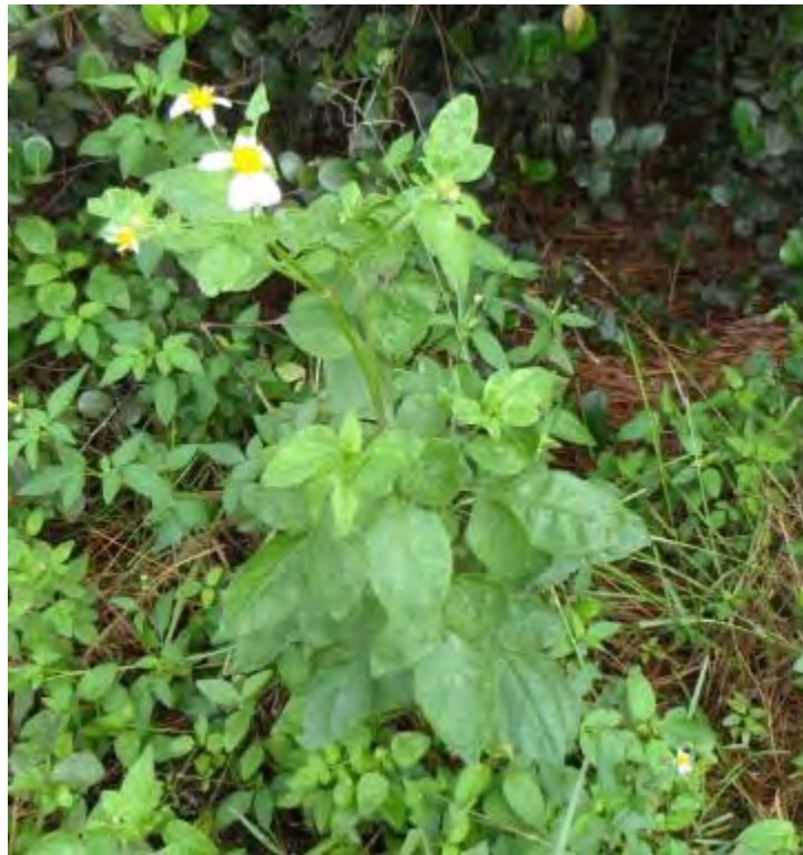
Bidens alba (Asteraceae) – Spanish Needle