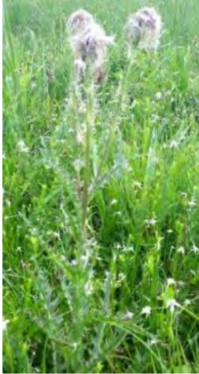
Cirsium horridulum (Asteraceae) – Yellow Thistle