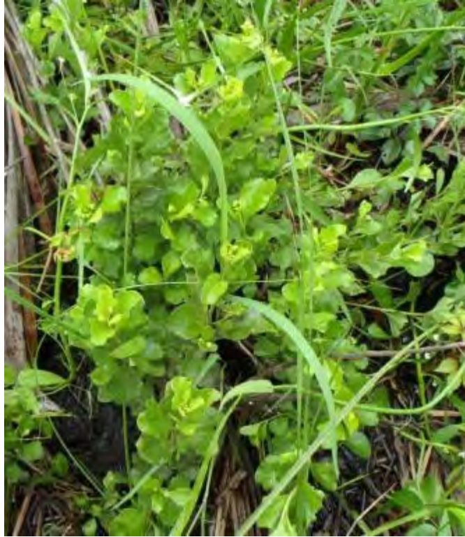
Baccharis halimifolia (Asteraceae) - Saltbush (Groundsel)