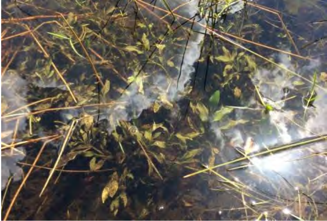
Potamogeton illinoensis (Potamogetonaceae) – Illinois Pondweed