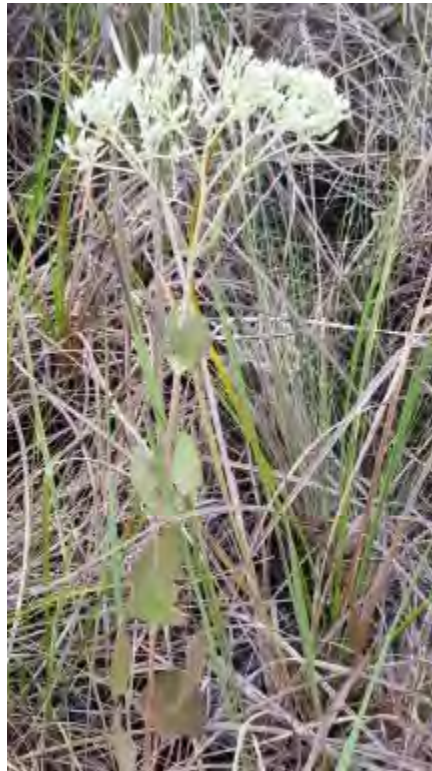
Eupatorium mikanioides (Asteraceae) – Semaphore Thoroughwort