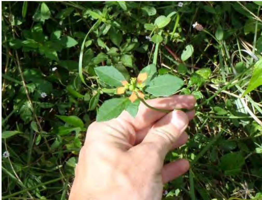
Poinsettia cyathophora (Euphorbiaceae) – Painted Leaf