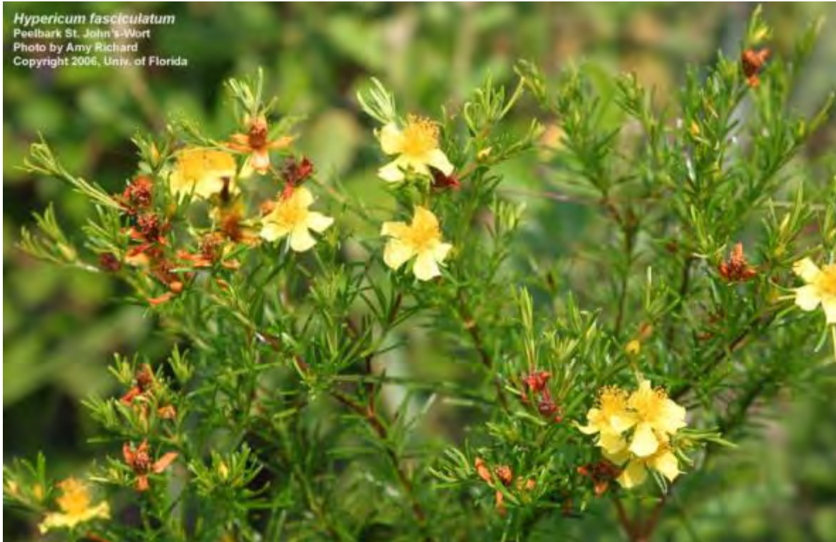
Hypericum fasciculatum (Clusiaceae) - St. Johnswort (Sandweed)