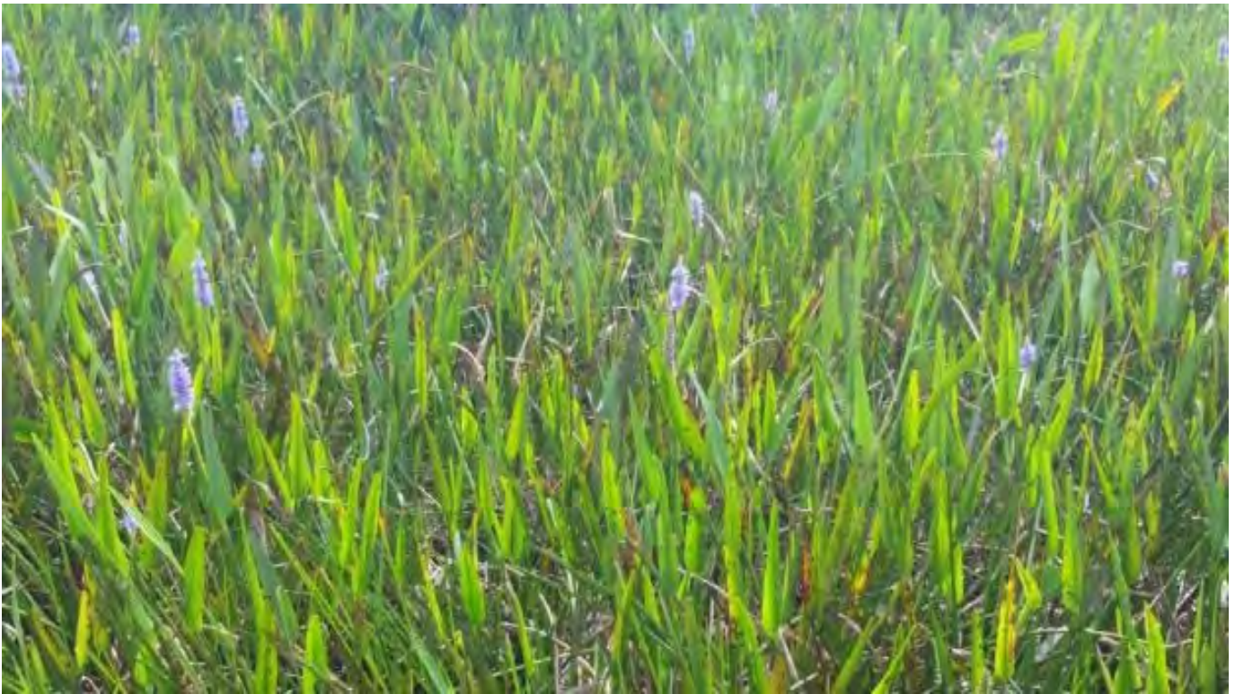
Pontederia cordata (Pontederiaceae) – Pickerelweed