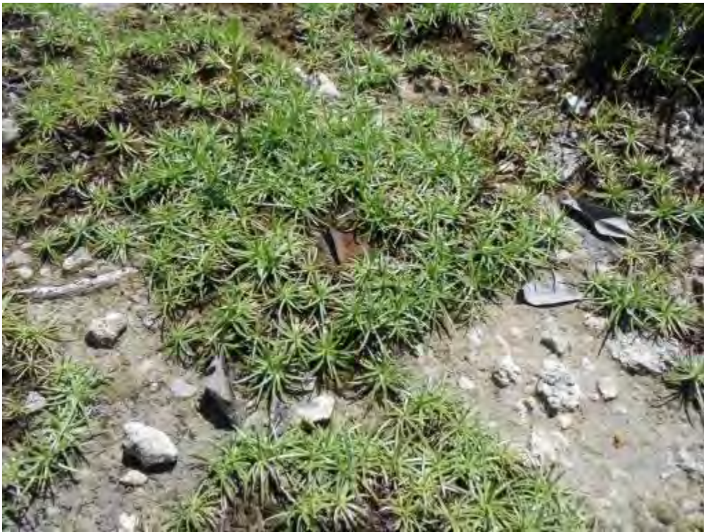
Cyperus pendunculatus (Cyperaceae) – Beach Star