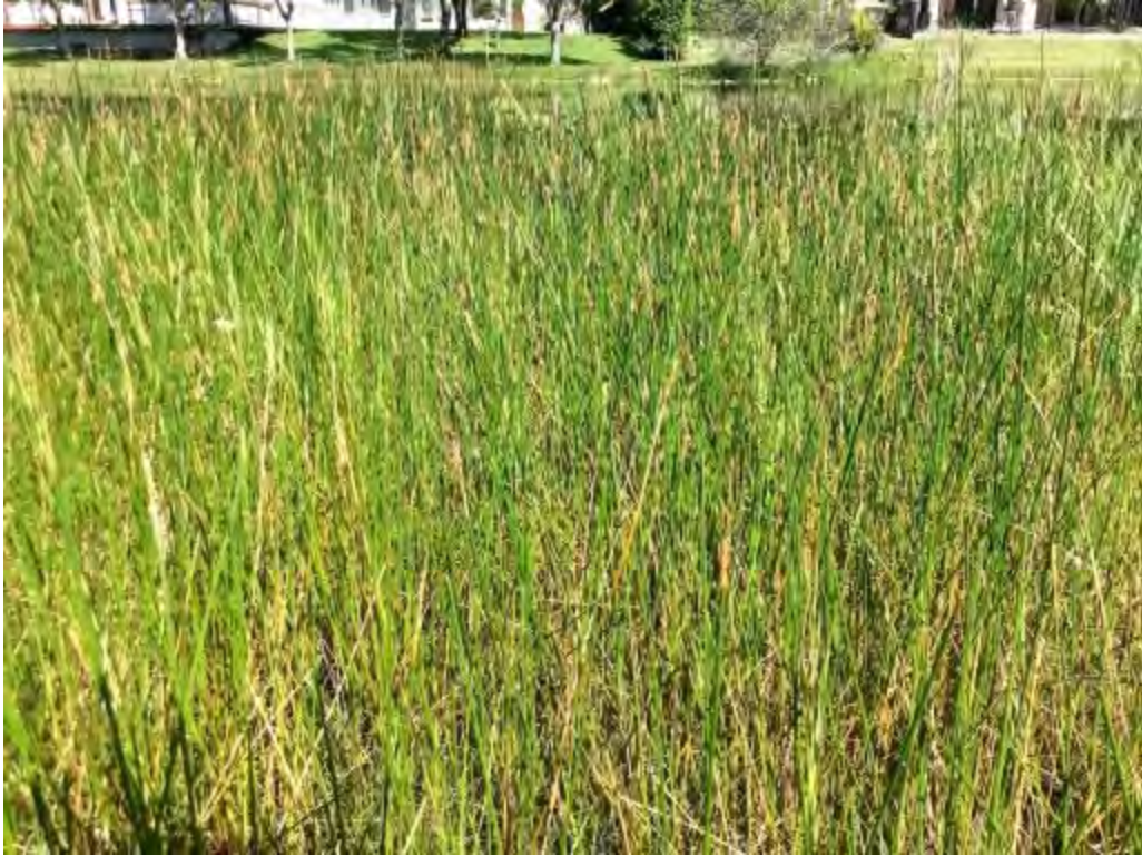
Eleocharis cellulosa (Cyperaceae) – Gulf Coast Spikerush