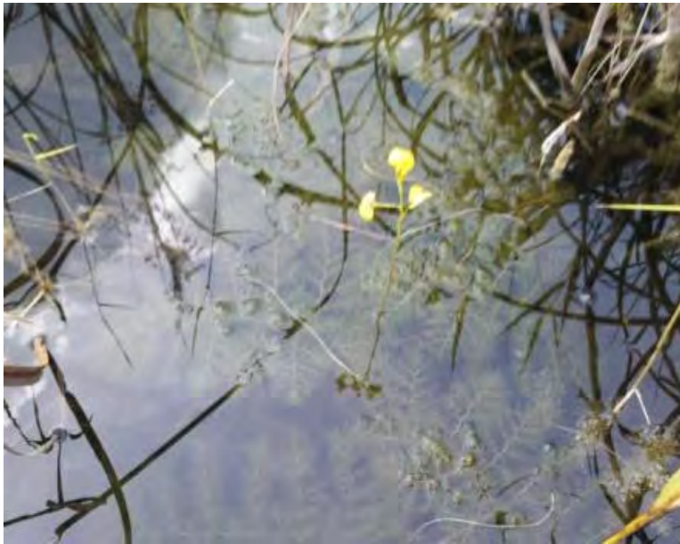
Utricularia floridana (Lentibulariaceae) – Florida Yellow Bladderwort