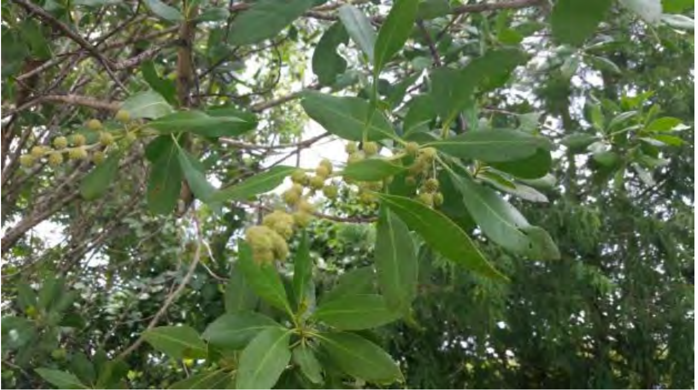
Conocarpus erectus (Combretaceae) - Green Buttonwood