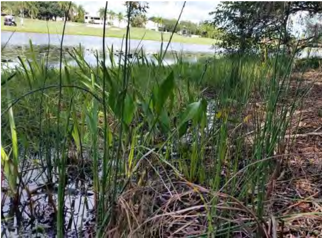
Equisetum hyemale (Equisetaceae) – Horsetail