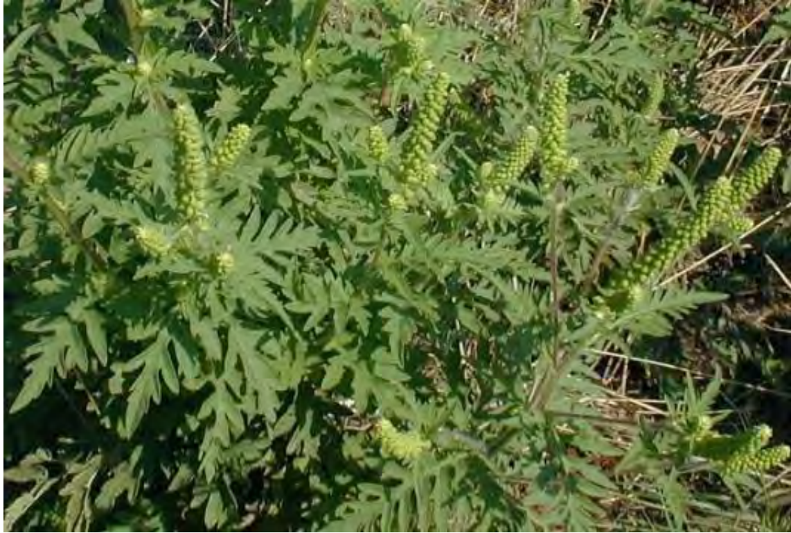
Ambrosia artemisiifolia (Asteraceae) – Ragweed