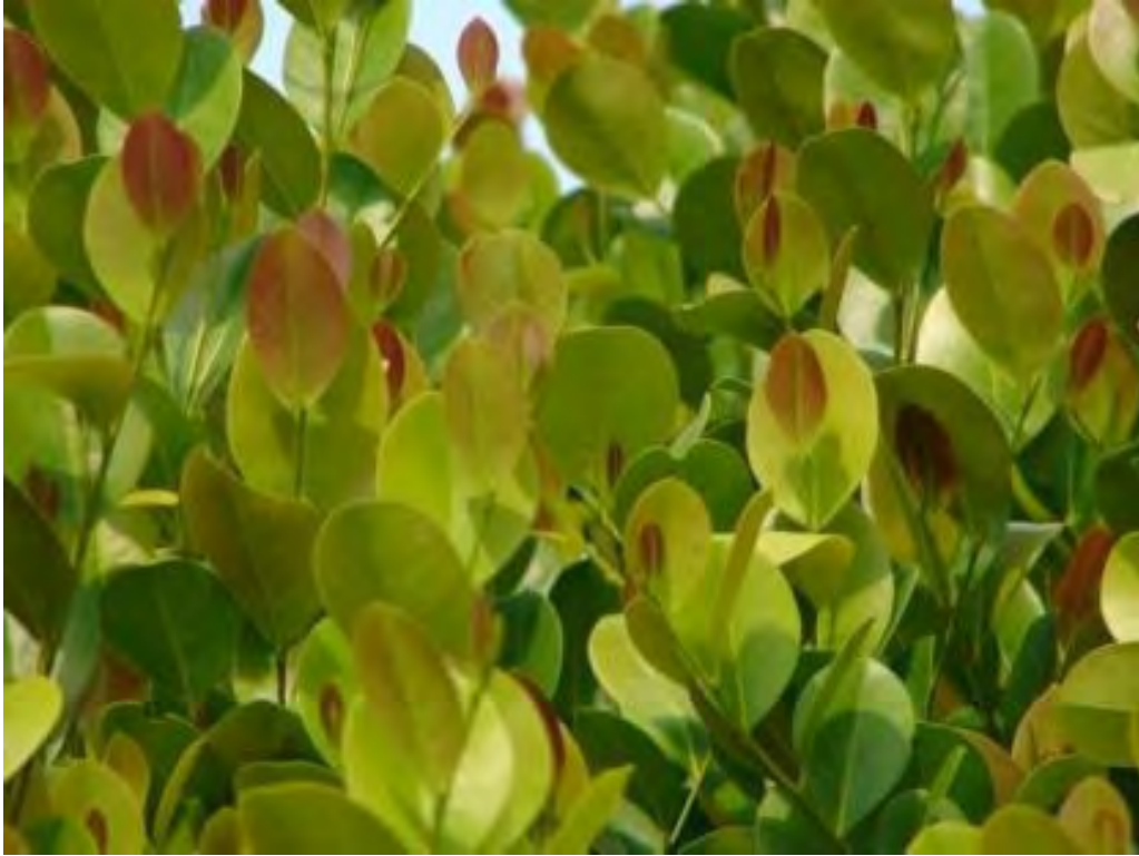
Chrysobalanus icaco (Chrysobalanaceae) – Cocoplum