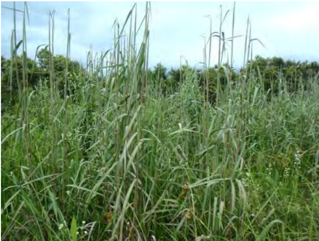
Saccharum giganteum (Poaceae) – Sugarcane Plumegrass