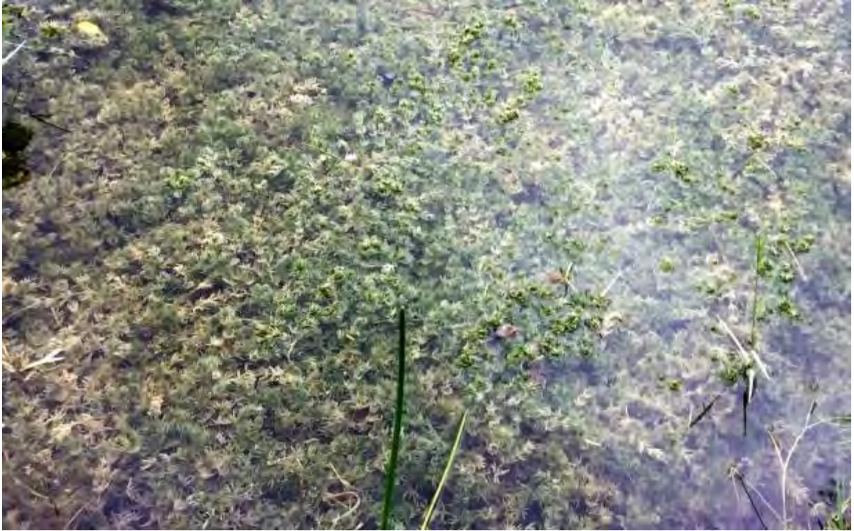
Chara sp. (Characeae) – Chara