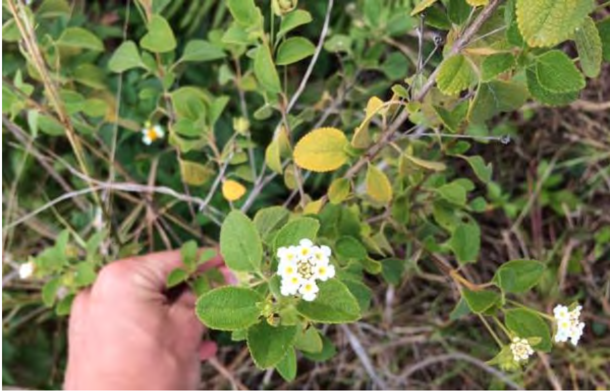
Lantana involucrata (Verbenaceae) - Buttonsage