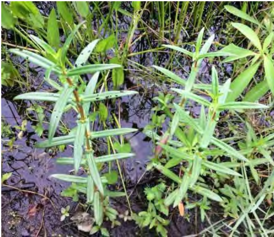
Ammannia latifolia (Lythraceae) – Toothcups