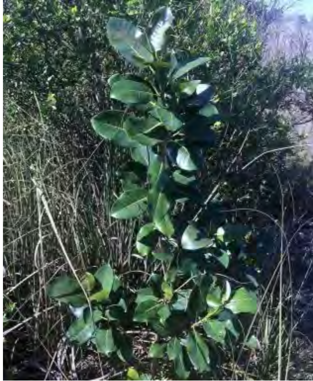
Ficus aurea (Moraceae) – Strangler Fig