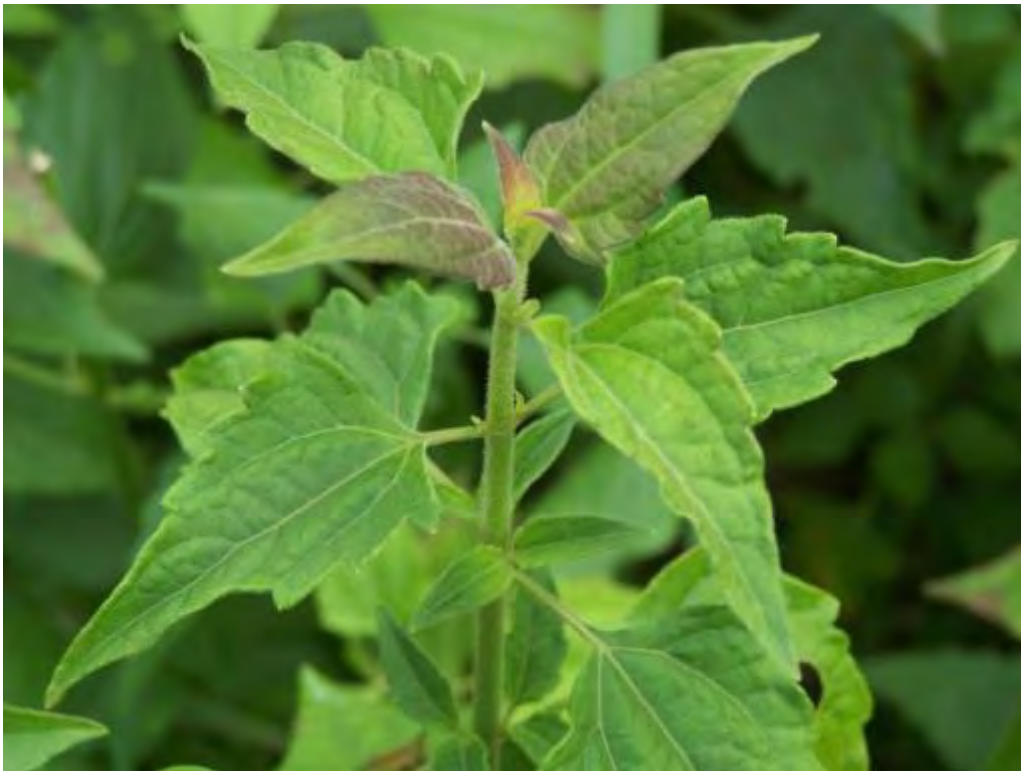
Chromolaena odorata (Asteraceae) – Jack in the Bush