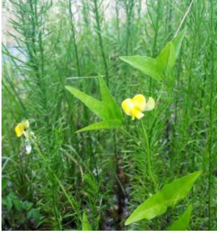
Vigna luteola (Fabaceae) – Hairypod Cowpea