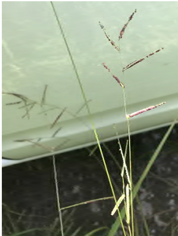
Paspalum floridanum (Poaceae) – Florida Paspalum