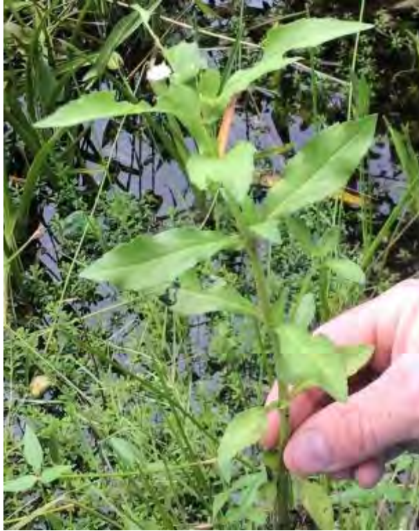
Eclipta prostrata (Asteraceae) – False daisy