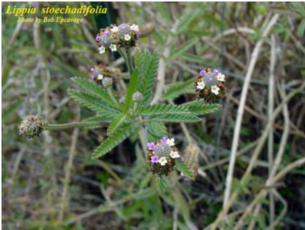
Lippia stoechadifolia (Verbenaceae) – Southern Frogfruit (Endangered –State)