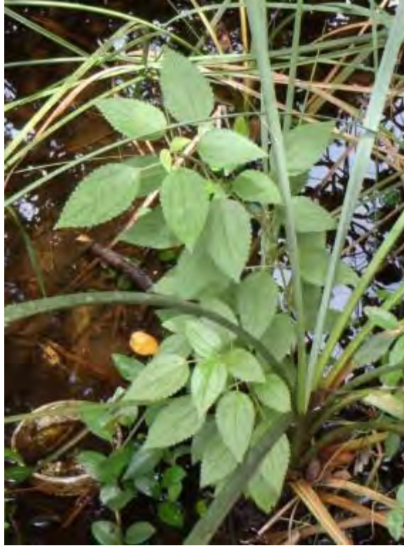
Boehmeria cylindrica (Urticaceae) – False Nettle