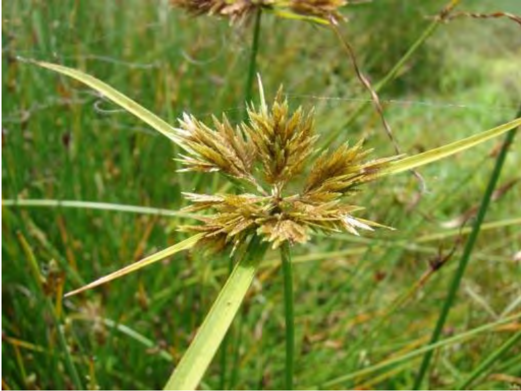
Cyperus polystachyos (Cyperaceae) – Flat Sedge