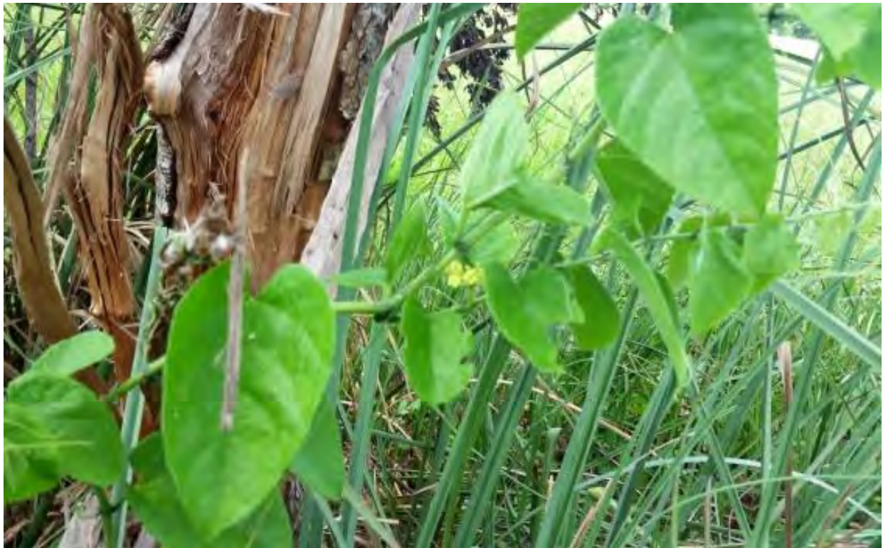
Cissus verticillata (Vitaceae) – Possum Grape