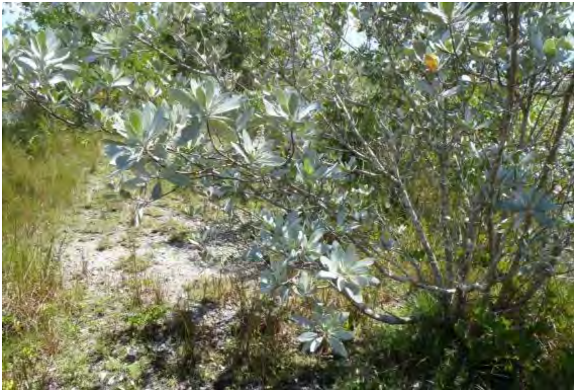
Conocarpus erectus var. sericeus (Combretaceae) – Silver Buttonwood