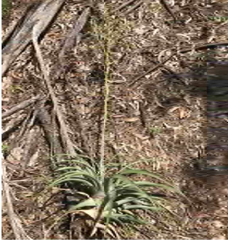
Tillandsia utriculata (Bromeliaceae) – Giant Airplant (Endangered – State)