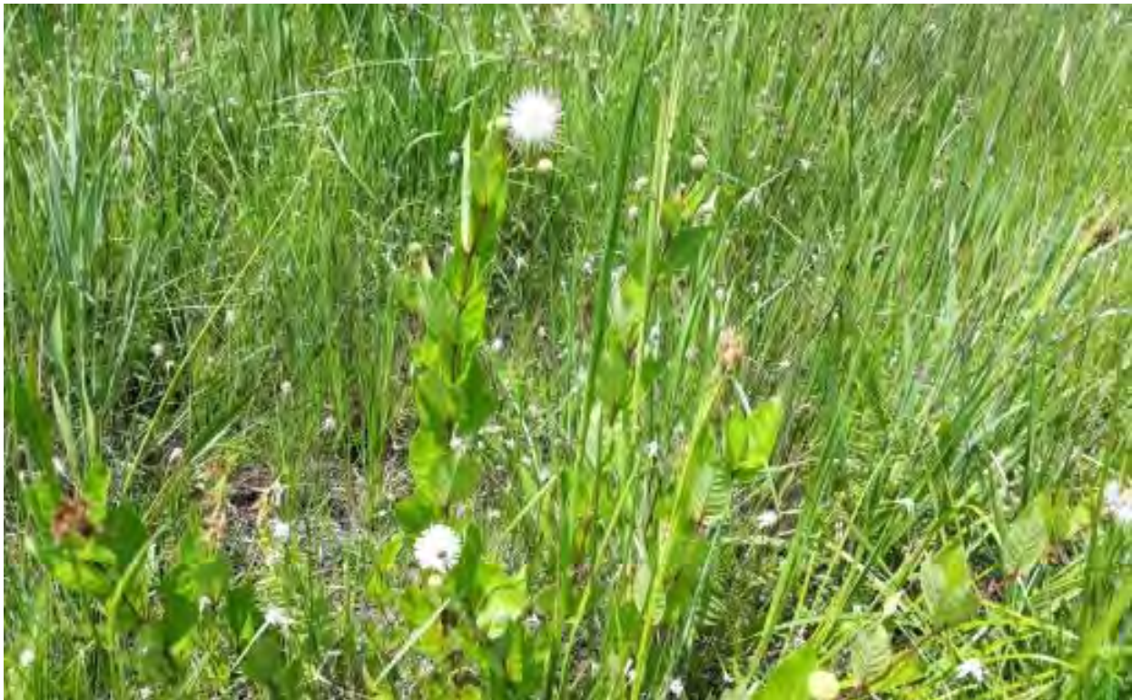
Cephalanthus occidentalis (Rubiaceae) – Common Buttonbush