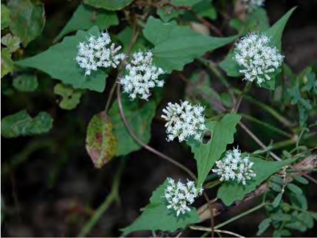
Mikania scandens (Asteraceae) – Hempvine