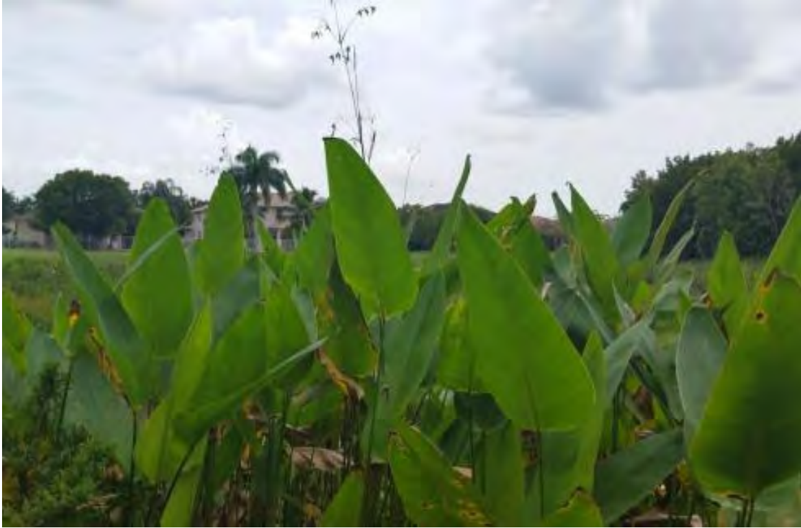
Thalia geniculata (Marantaceae) – Alligator Flag