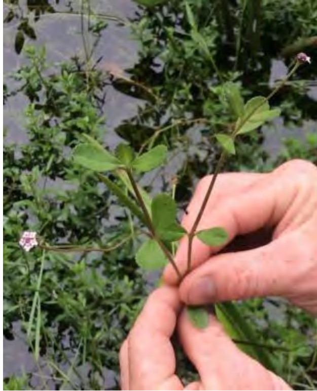
Phyla nodiflora (Verbenaceae) – Turkey Tangle Fogfruit