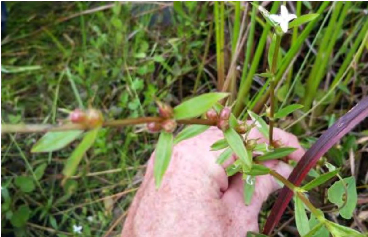
Diodia teres (Rubiaceae) – Poorjoe