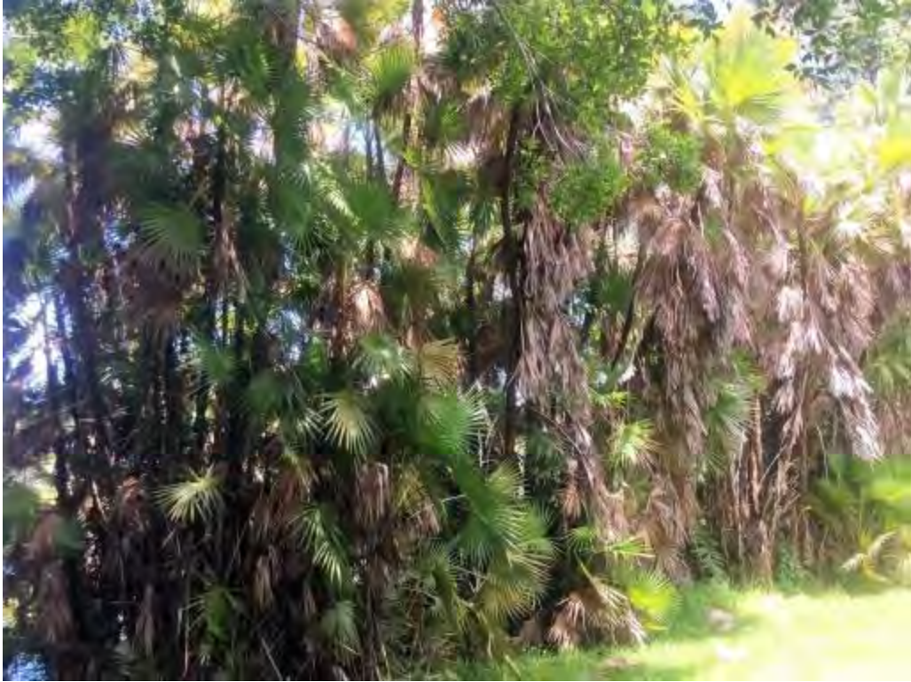
Acoelorrhaphe wrightii (Arecaceae) – Paurotis Palm