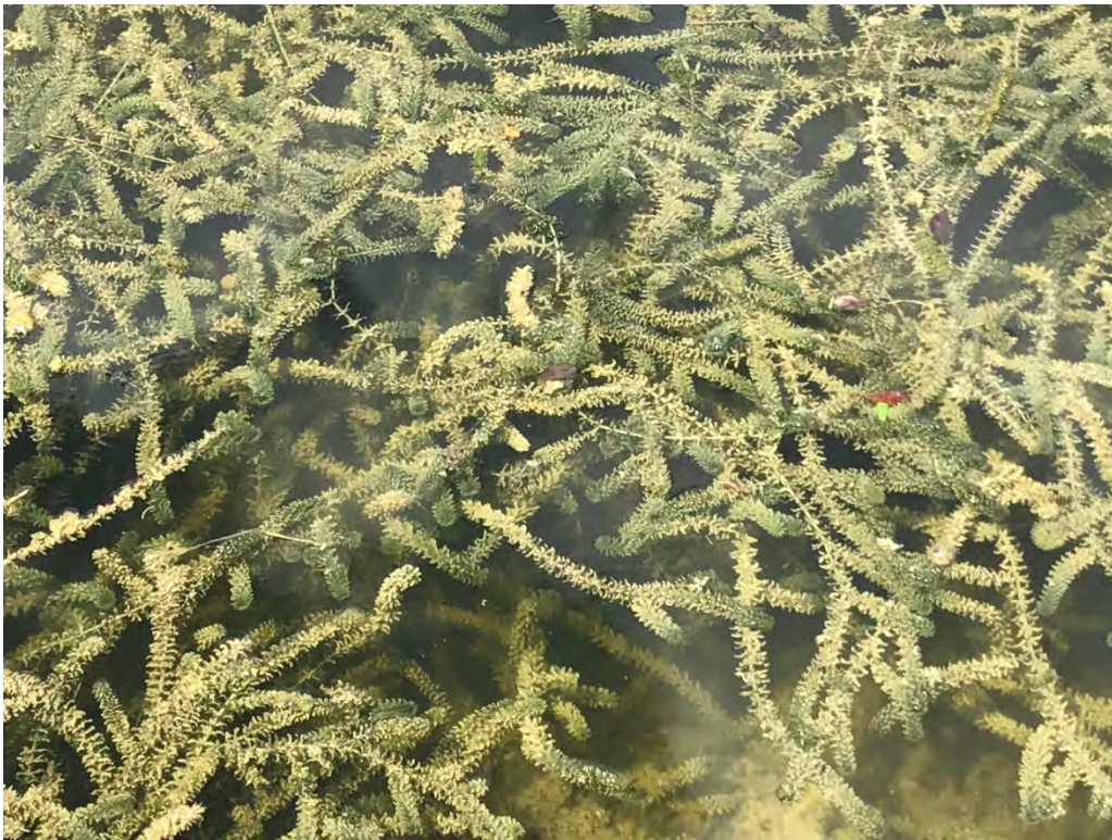
Elodea canadensis (Hydrocharitaceae) – Canadian Waterweed