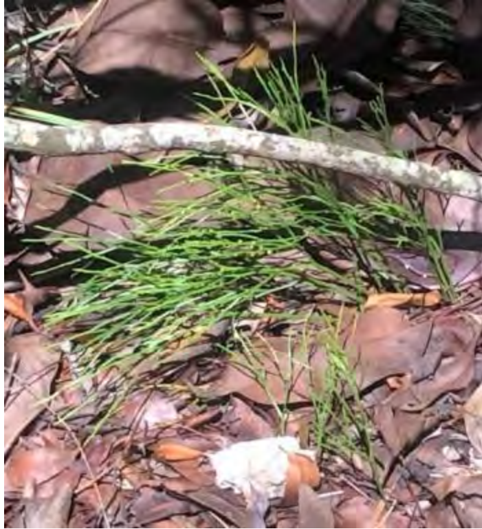
Psilotum nudum (Psilotaceae) – Whisk Fern