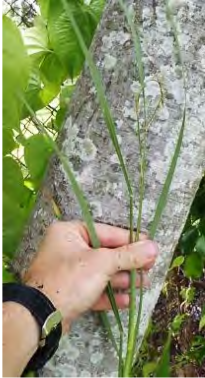
Paspalidium geminatum (Poaceae) – Egyptian Paspalidium