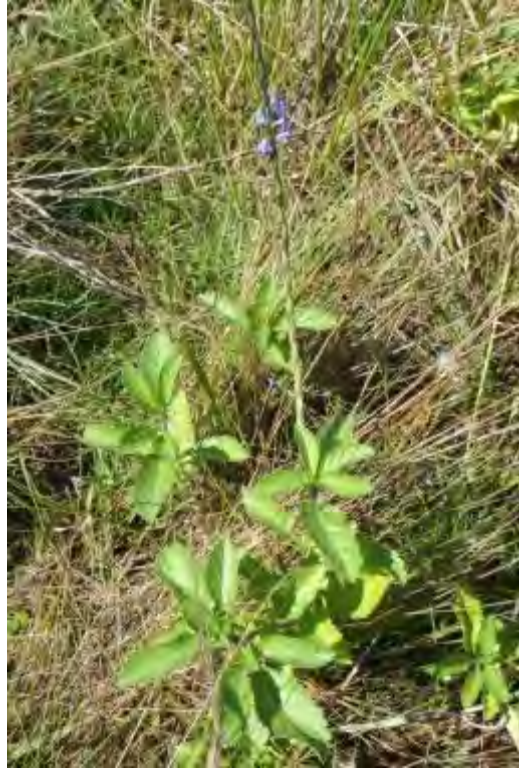
Stachytarpheta jamaicensis (Verbenaceae) – Blue Porterweed