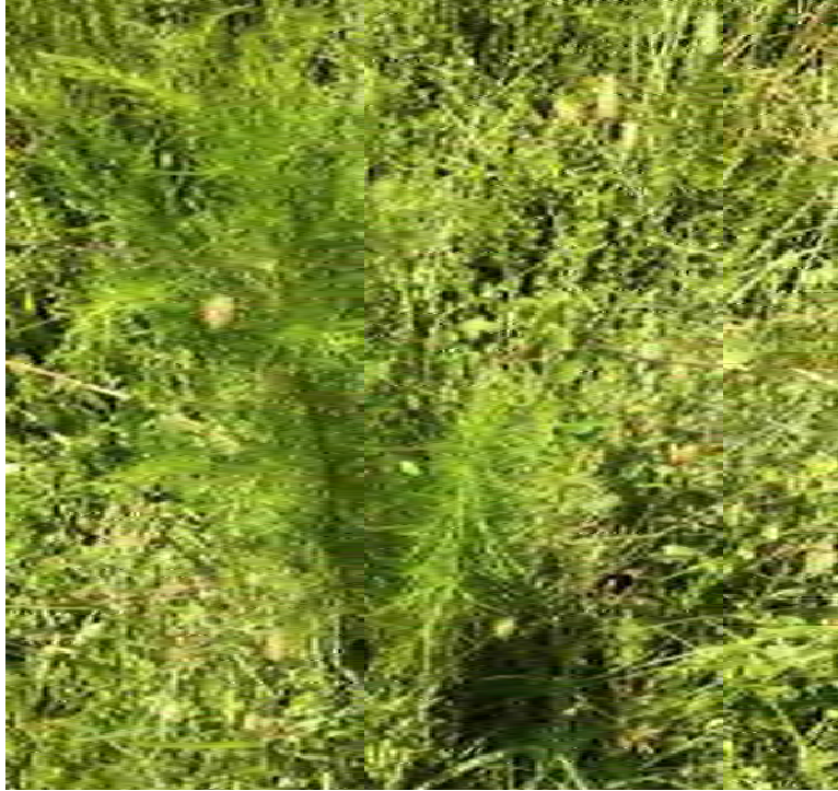
Eupatorium capillifolium (Asteraceae) – Dog Fennel