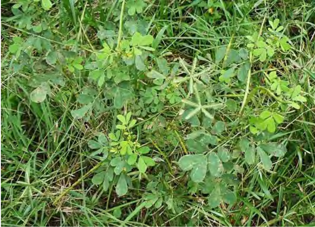
Senna obtusifolia (Fabaceae) – Sicklepod