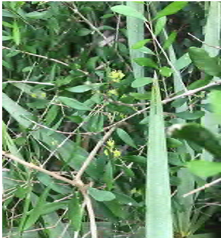
Sideroxylon reclinatum (Sapotaceae) – Florida Bully