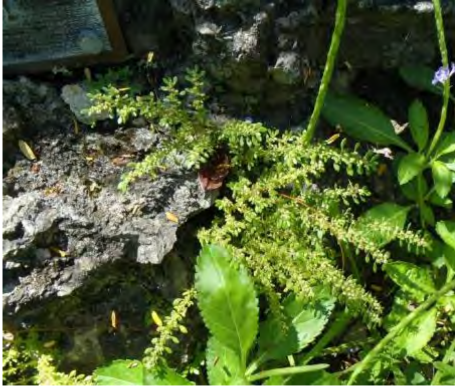
Pilea microphylla (Urticaceae) – Artillery Plant