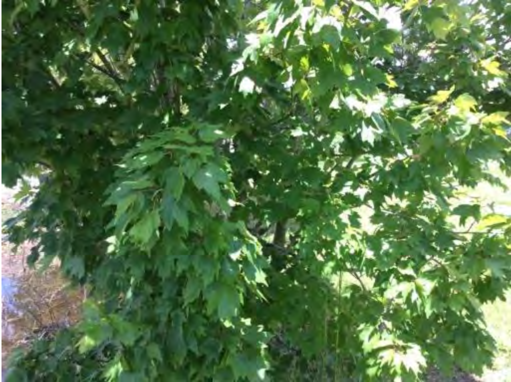
Acer rubrum (Aceraceae) - Red Maple