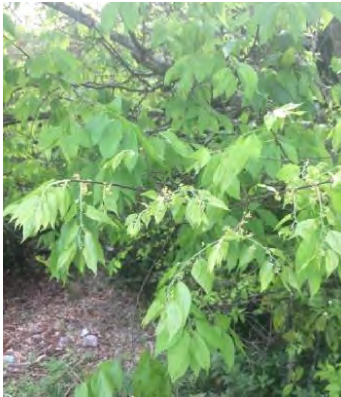
Celtis laevigata (Cannabaceae) – Hackberry