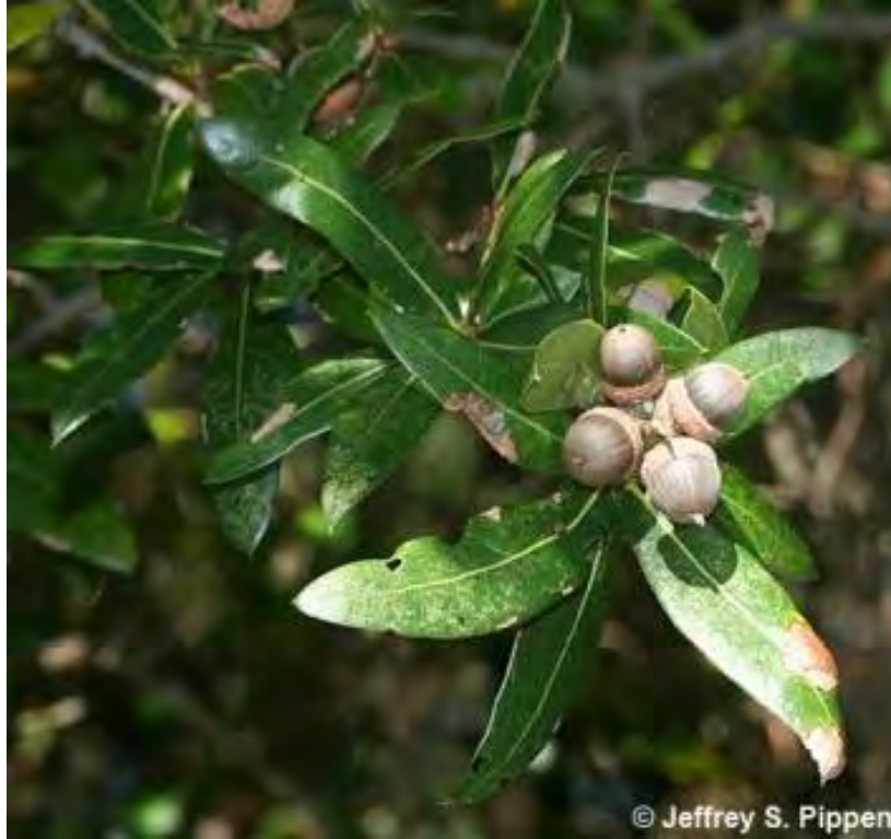
Quercus laurifolia (Fagaceae) – Laurel Oak