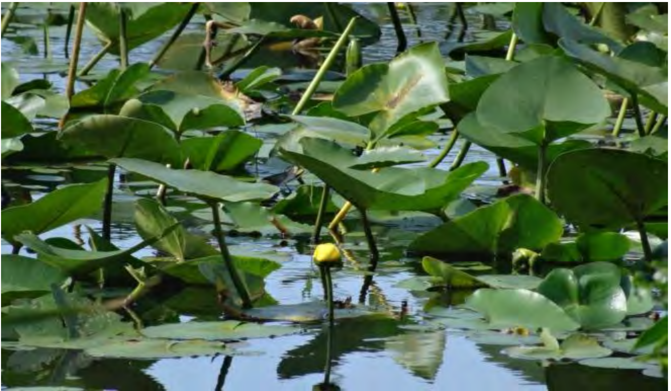
Nuphar lutea (Nymphaeaceae) – Spatterdock