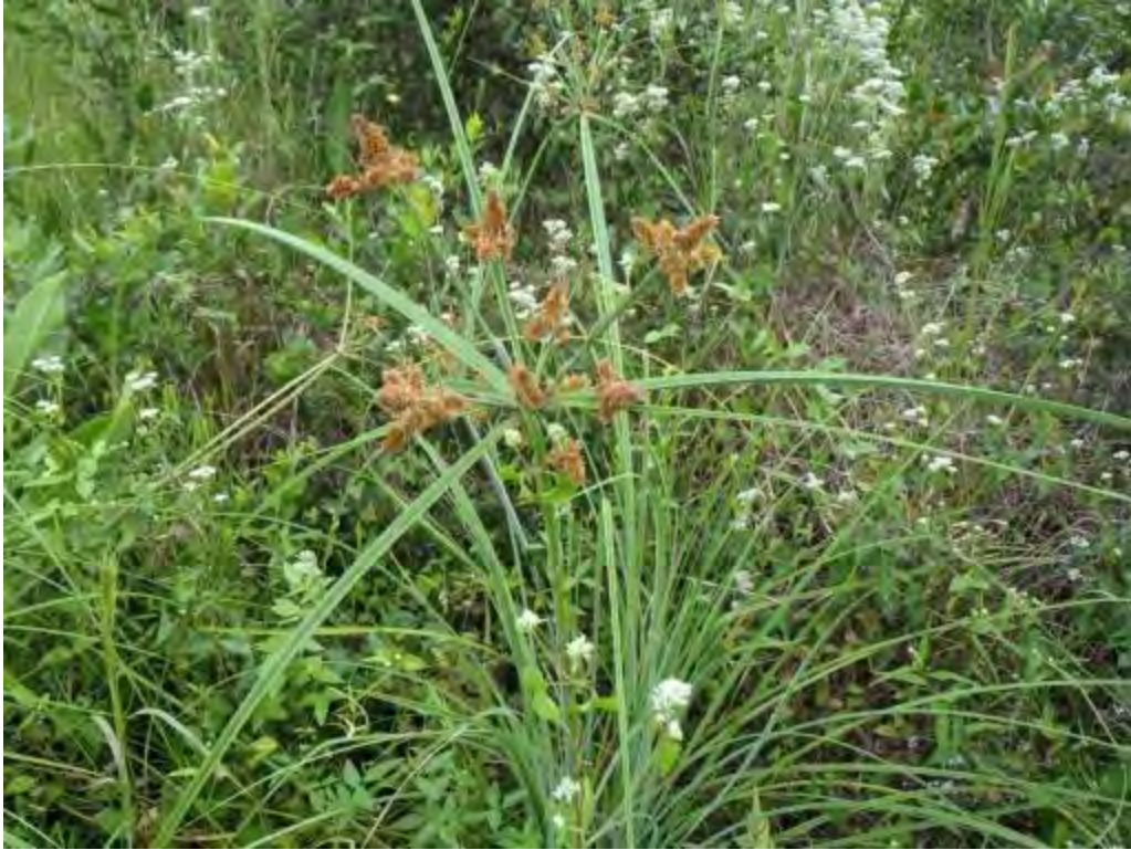
Cyperus ligularis (Cyperaceae) – Swamp Flatsedge