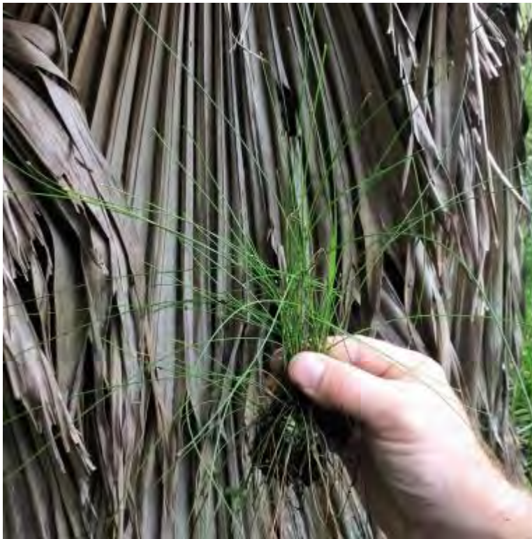
Eleocharis baldwinii (Cyperaceae) – Baldwin's Spikerush