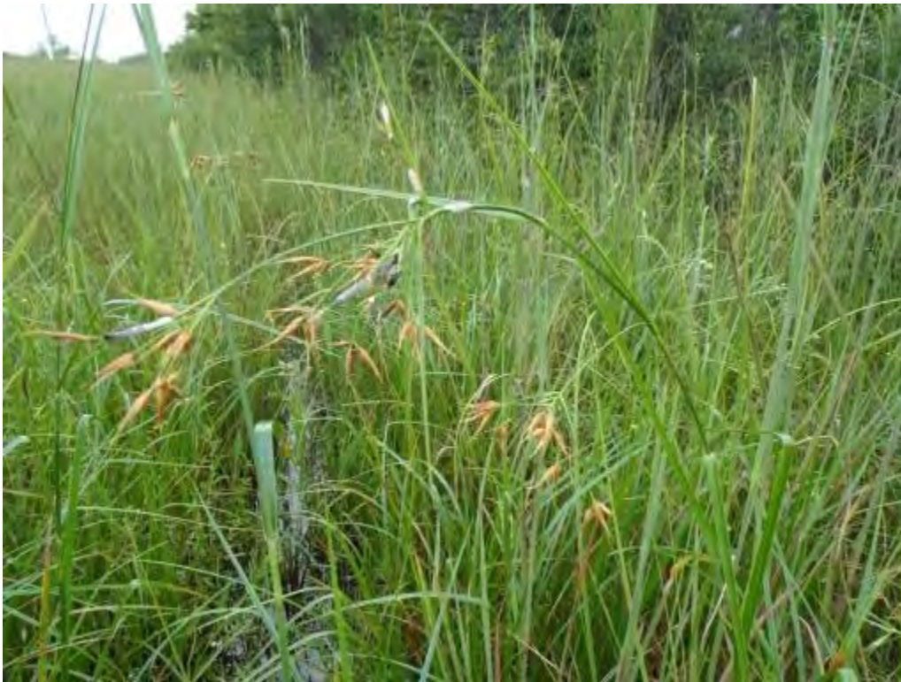
Rhynchospora inundata (Cyperaceae) – Horned Beaksedge