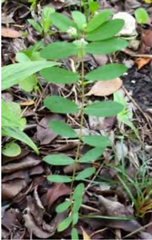
Chamaesyce sp. (Euphorbiaceae) – Ground Spurge