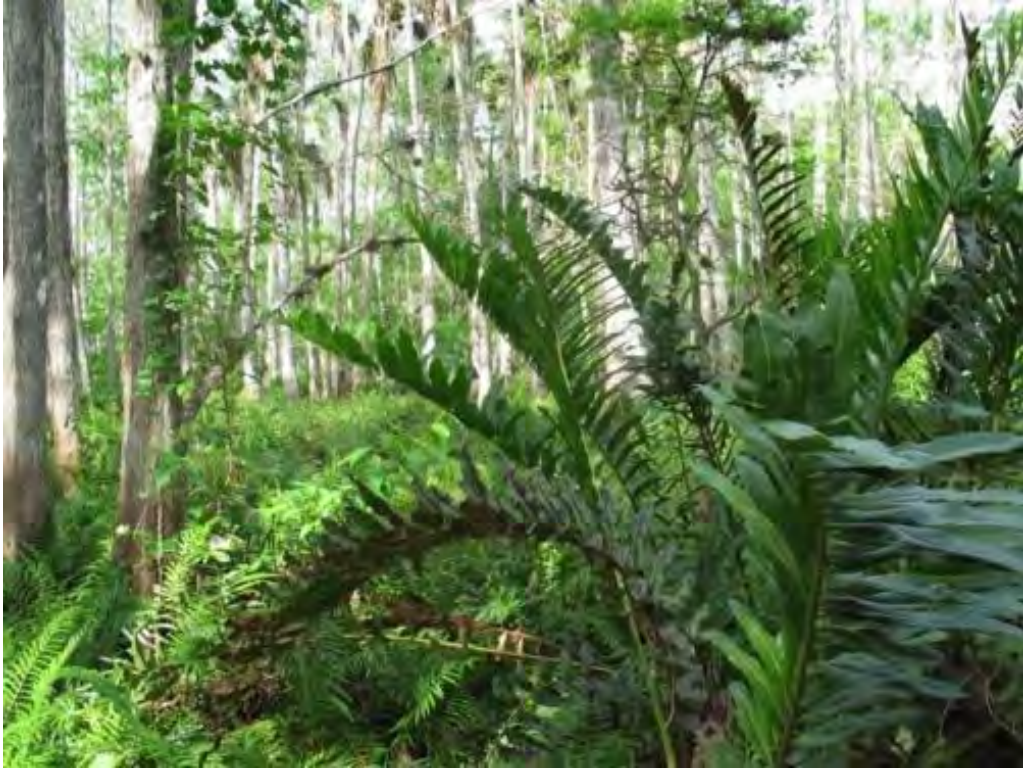
Acrostichum danaeifolium (Pteridaceae) – Leatherfern