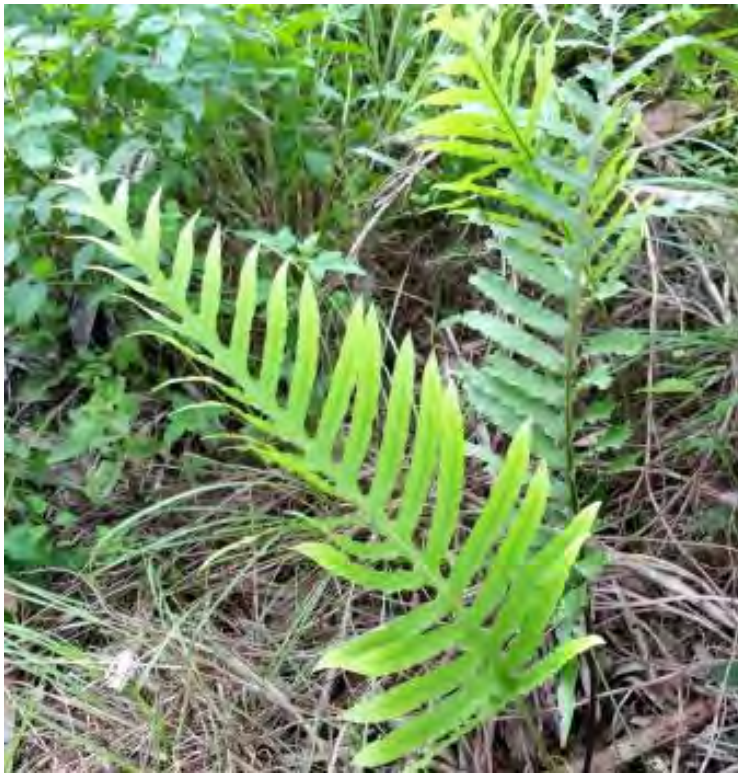
Phlebodium aureum (Polypodiaceae) – Golden Polypody