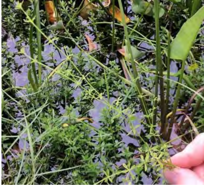
Galium tinctorium (Rubiaceae) – Stiff Marsh Bedstraw