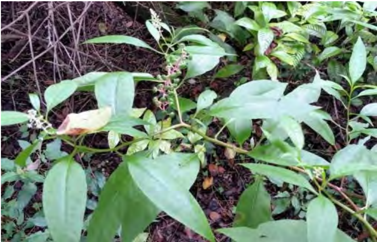
Phytolacca americana (Phytolaccaceae) – American Pokeweed