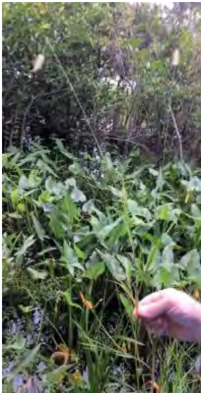
Setaria sp. (Poaceae) - Foxtail