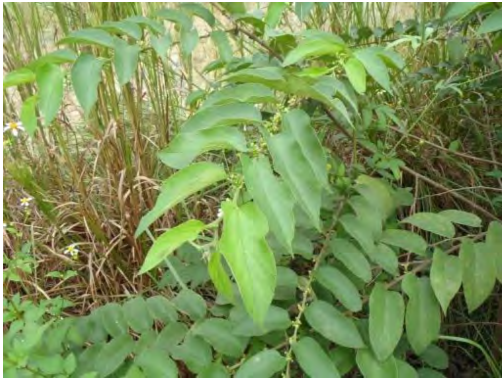
Trema micrantha (Ulmaceae) – Florida Trema