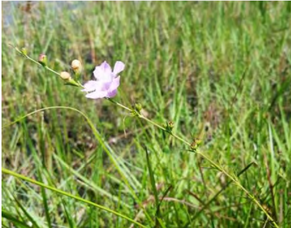
Agalinis sp. (Scrophulariaceae) – False Foxglove