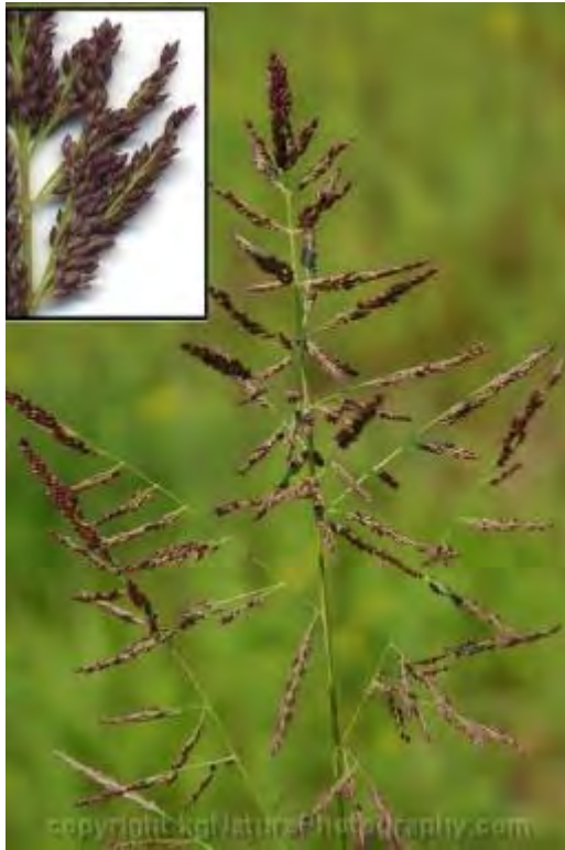
Panicum rigidulum (Poaceae) – Red Top Grass