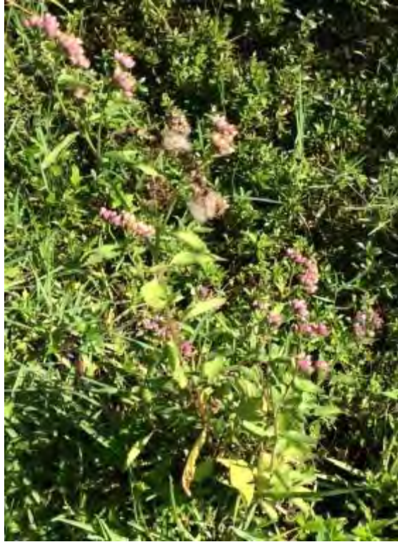
Pluchea odorata (Asteraceae) – Sweetscent