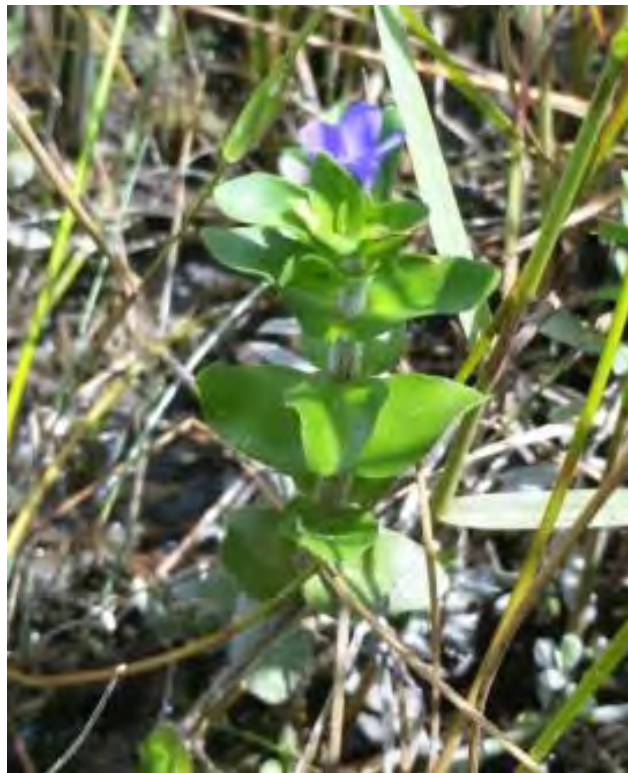
Bacopa caroliniana (Scrophulariaceae) – Lemon Hyssop