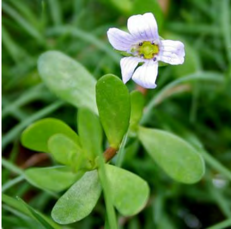
Bacopa monnieri (Scrophulariaceae) – Herb of Grace