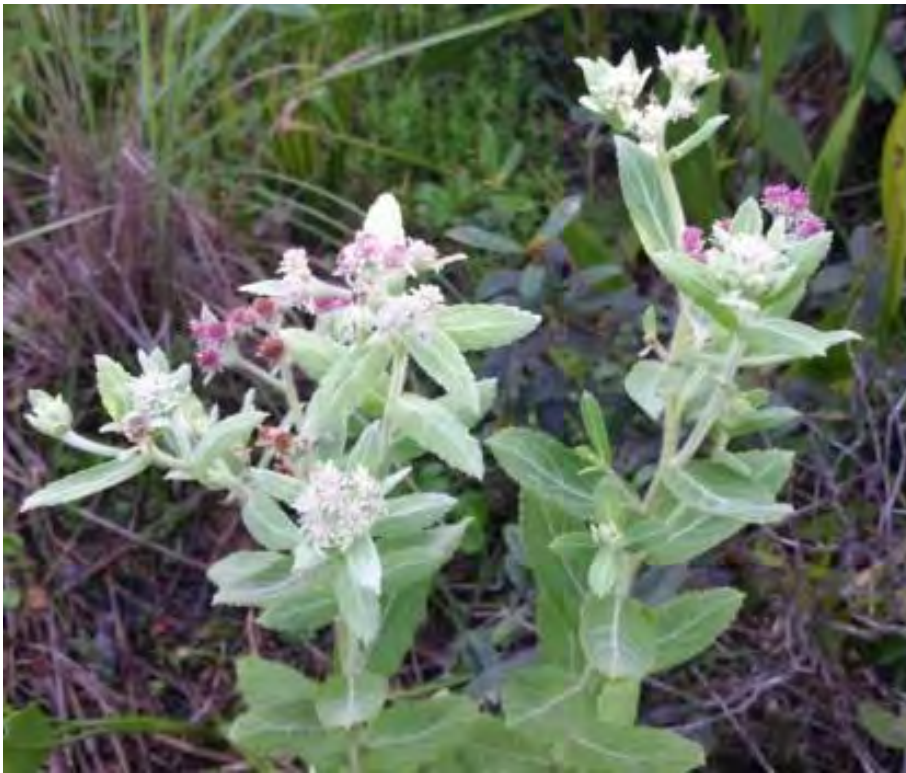
Pluchea baccharis (Asteraceae) - Rosy Camphorweed