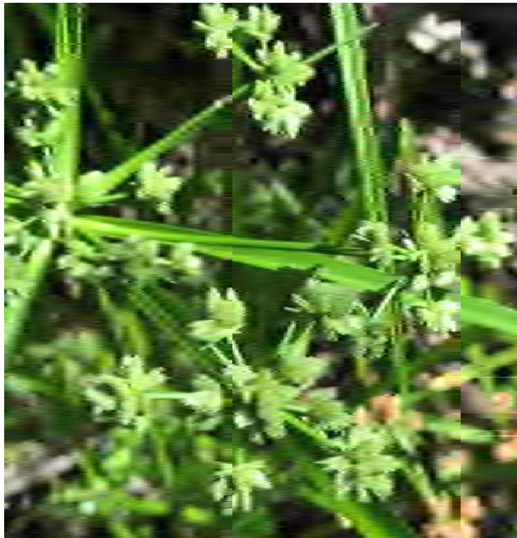
Cyperus virens (Cyperaceae) – Green Flatsedge