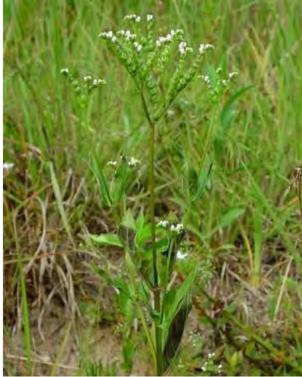
Mitreola petiolata (Loganiaceae) – Miterwort