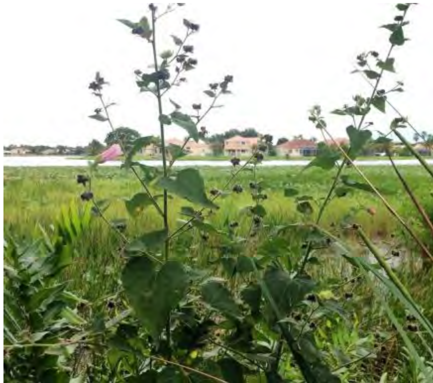
Kosteletzkya virginica (Malvaceae) – Virginia Saltmarsh Mallow