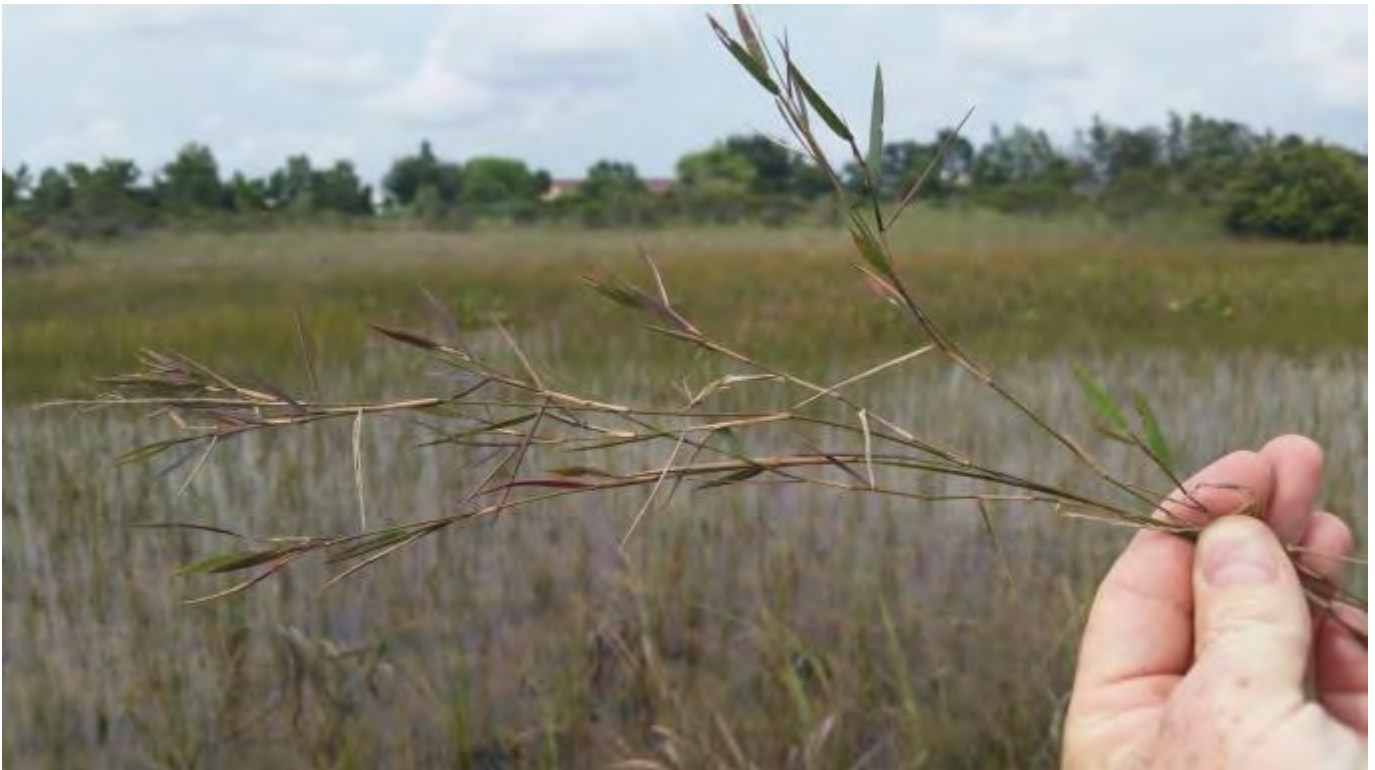
Dicanthelium erectifolium (Poaceae) – Erectleaf Witchgrass