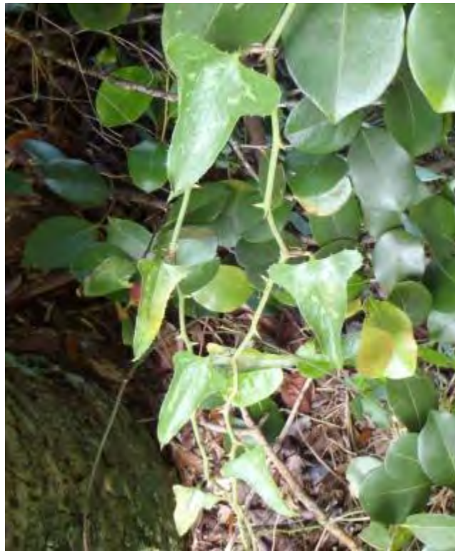
Smilax bona-nox (Smilacaceae) – Saw Greenbriar