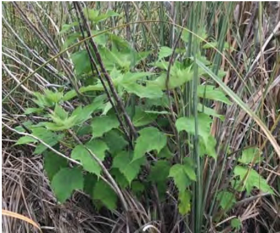
Hibiscus grandiflorus (Malvaceae) – Swamp Rosemallow