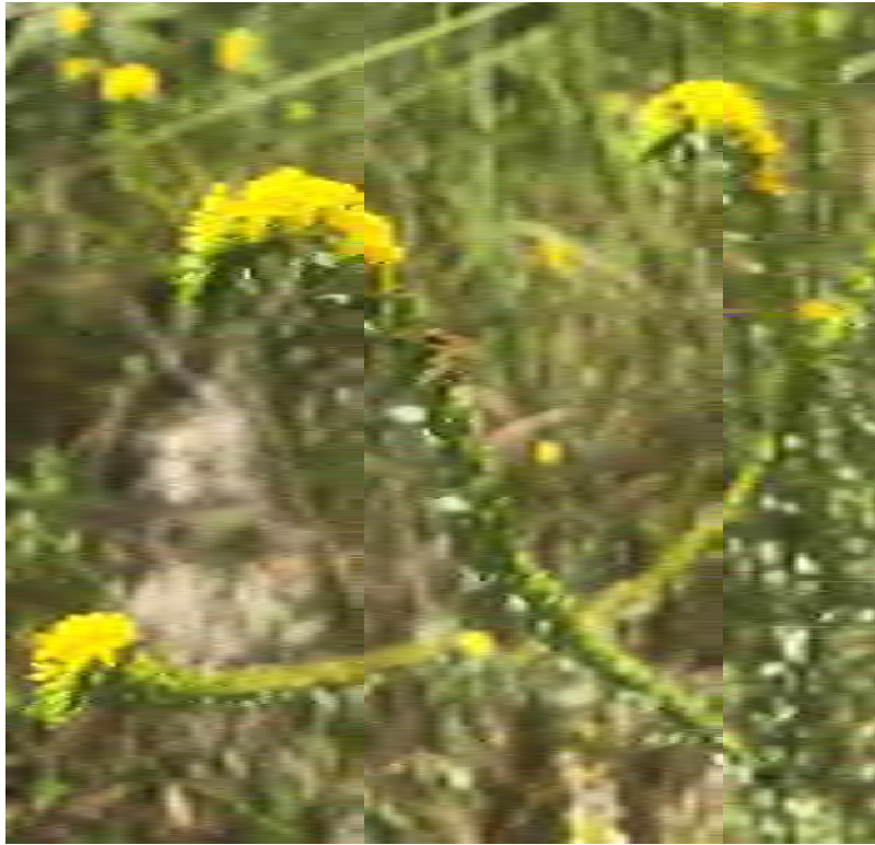
Euploca polyphylla (Boraginaceae) – Pineland Heliotrope