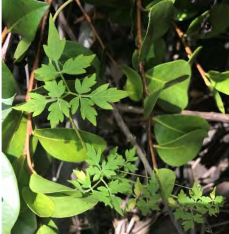
Cissus trifoliata (Vitaceae) – Sorrelvine/Marine Vine