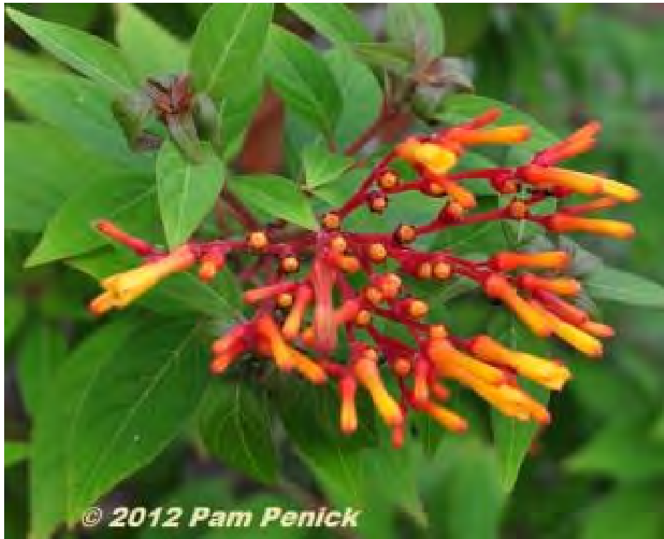
Hamelia patens (Rubiaceae) - Firebush