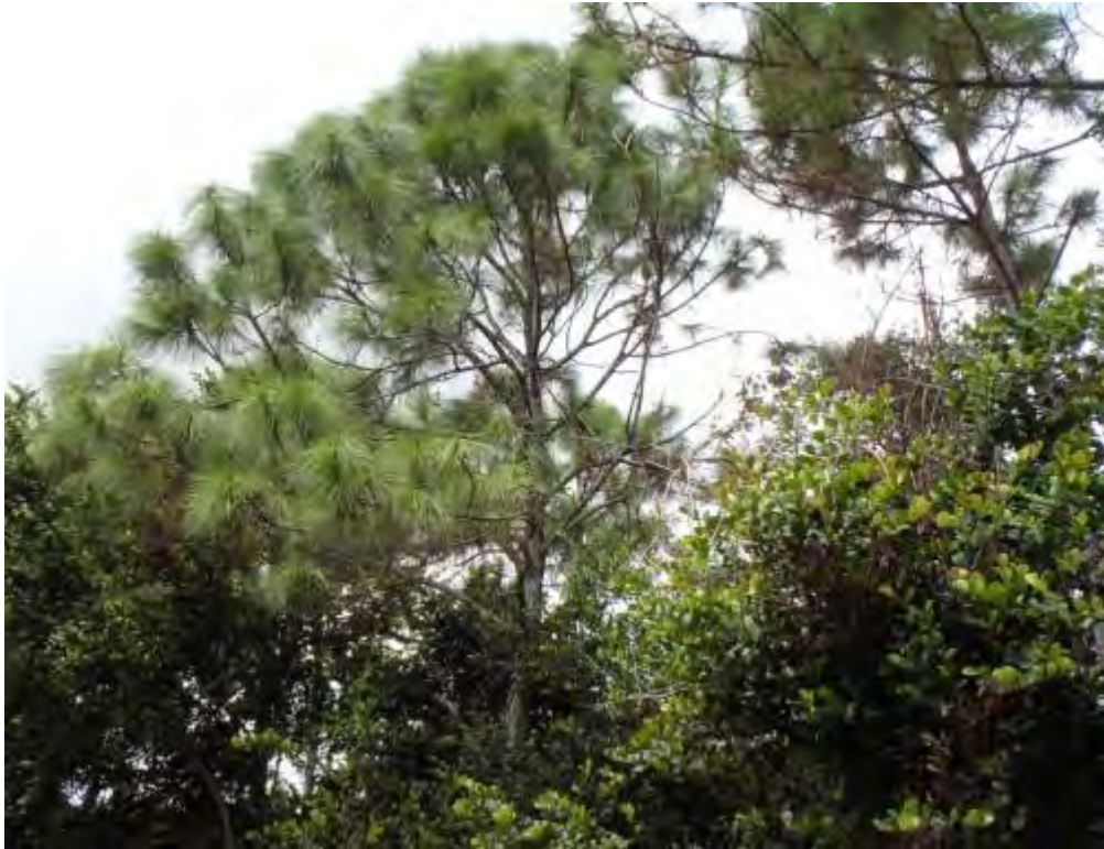
Pinus elliottii (Pinaceae) – Slash Pine