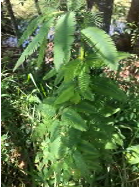
Aeschynomene americana (Fabaceae) – Shyleaf Joint Vetch