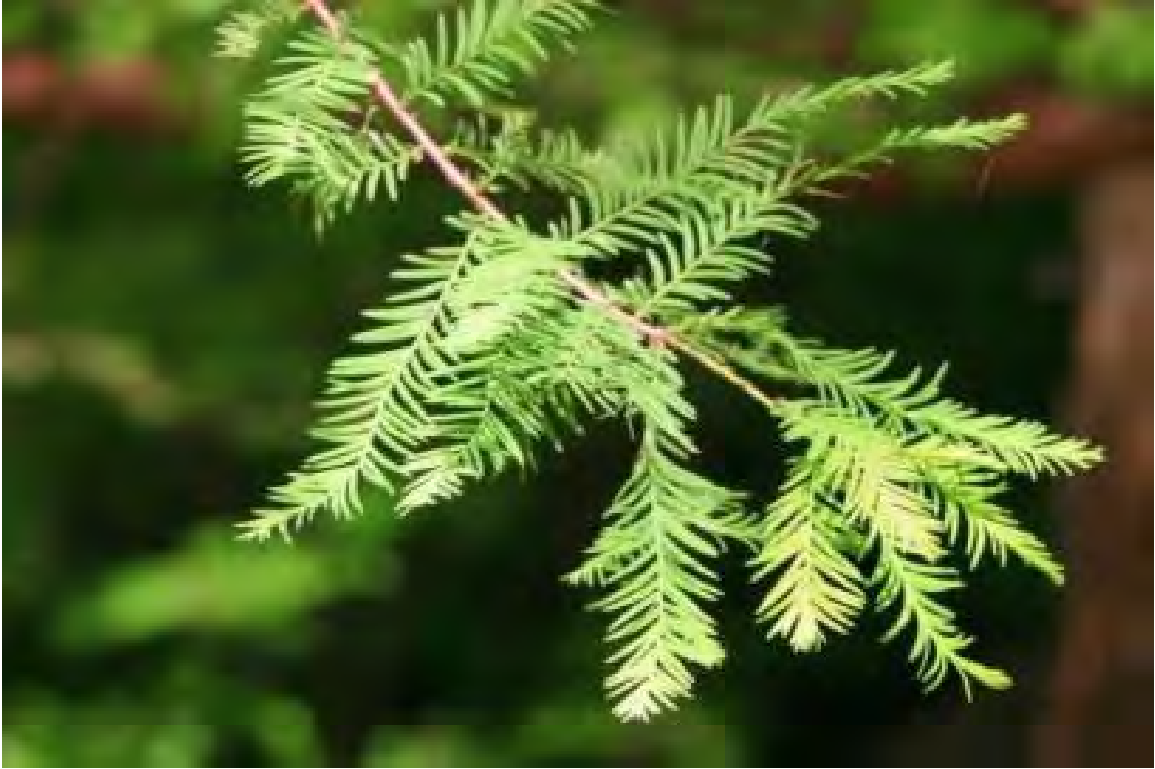
Taxodium distichum (Cupressaceae) - Bald Cypress