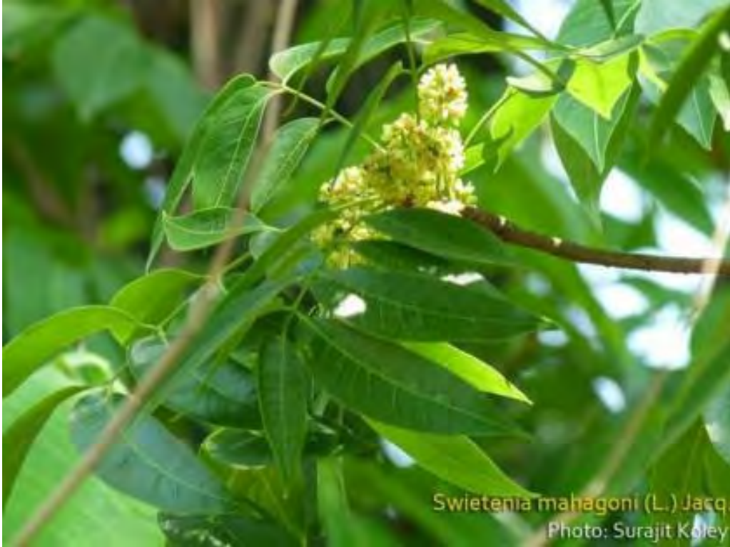
Swietenia mahagoni (Meliaceae) – Mahogany