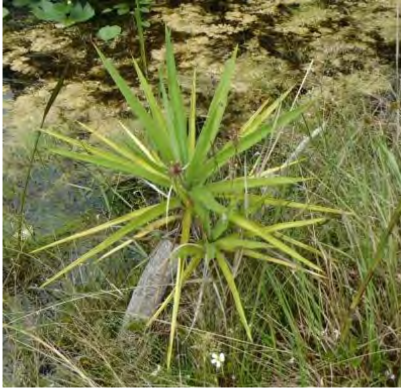
Yucca aloifolia (Agavaceae) – Spanish Bayonet