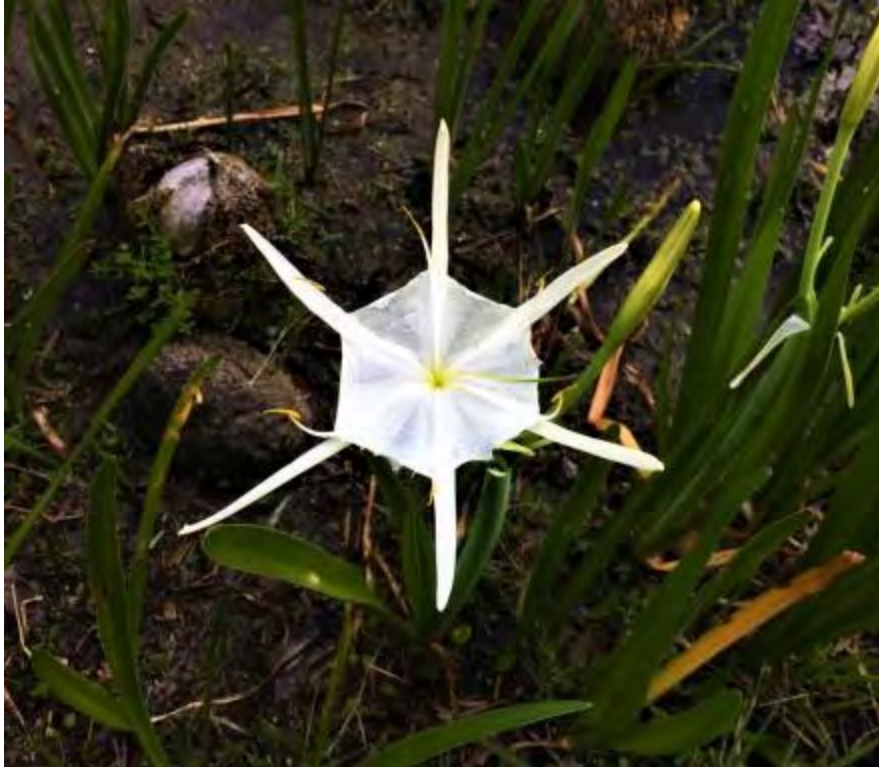
Hymenocallis tridentate (Amaryllidaceae) – Florida Spiderlily