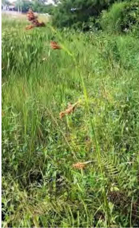
Rhynchospora odorata (Cyperaceae) – Fragrant Beaksedge