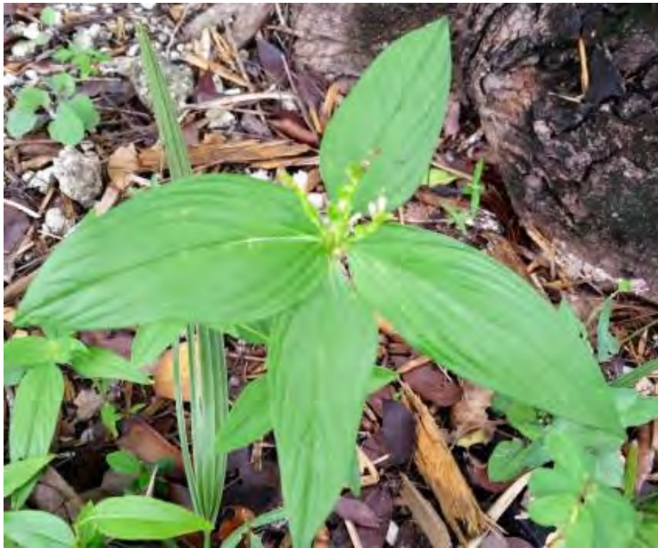
Spigelia anthelmia (Loganiaceae) – West Indian Pinkroot