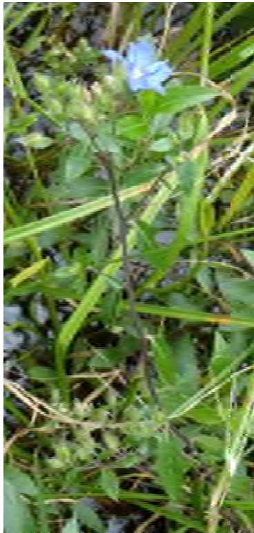
Hydrolea corymbosa (Hydroleaceae) – Skyflower