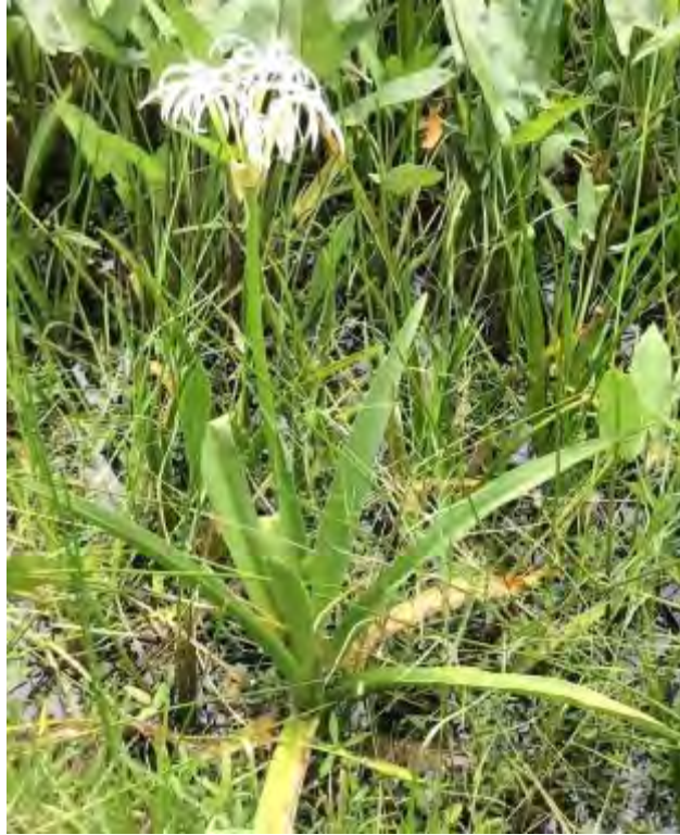
Crinum americanum (Liliaceae) – Swamp/String Lily