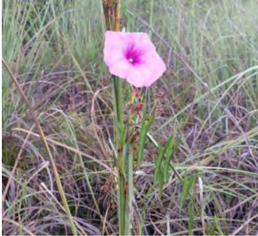
Ipomoea sagittata (Convolvulaceae) - Beach Morning Glory